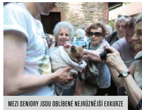
MEZI SENIORY JSOU OBLÍBENÉ NEJRŮZNĚJŠÍ EXKURZE

Pro využití svého volného času mohou senioři využít nabídku pěti klubů seniorů, které se nacházejí v ulici Na Louži, Karpatské, Počernické (v Bytovém domě Malešice), Sámově (v DSŽ Sámova) a Zvonkové (v DS Zvonková). Návštěvníci klubů se mohou účastnit přednášek na nejrůznější témata, besed se zajímavými osobnostmi, kurzů cvičení paměti, rekonvalescenčních cvičení, vycházek, jednodenních výletů i týdenních poznávacích a ozdravných pobytů. V klubech se scházejí zájmové kroužky, konají se zde taneční i poslechová hudební odpoledne. Senioři společně navštěvují výstavy, koncerty i divadelní představení. Kluby jsou otevřeny v pracovních dnech v odpoledních hodinách, zpravidla od 13.30 do 17.00 hod.