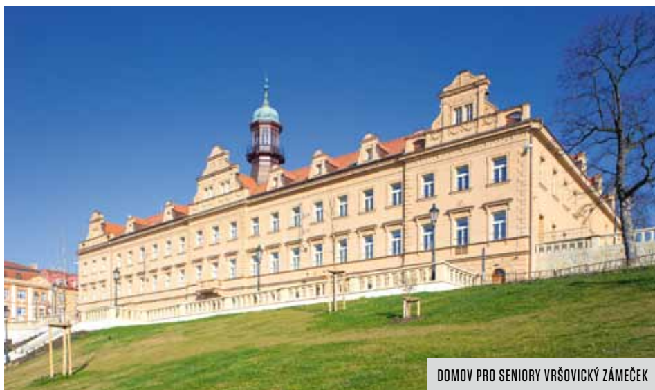
DOMOV PRO SENIORY VRŠOVICKÝ ZÁMEČEK

Snad každý se někdy dostal do situace, kdy potřeboval pomoc pro sebe, pro své blízké nebo třeba pro nemocné sousedy. Ne každý však ví, na koho se má v takovém případě obrátit. V naší městské části nabízí mnohostrannou pomoc Centrum sociální a ošetrovatelské pomoci v Praze 10 (dále jen CSOP) se sídlem v Sámově ulici č. 7. Jedná se o příspěvkovou organizaci, zřízenou naší městskou částí. Zaměřuje se především na pomoc seniorům a jejich rodinám, ale nabízí služby i rodičům s dětmi.