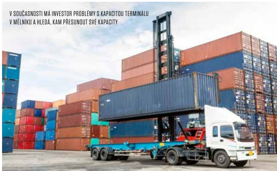
V SOUČASNOSTI MÁ INVESTOR PROBLÉMY S KAPACITOU TERMINÁLU V MĚLNÍKU A HLEDÁ, KAM PŘESUNOUT SVĚ KAPACITY