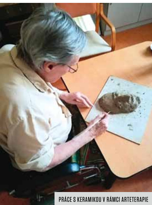
PŘÁCE S KERAMIKOU V RÁMCI ARTETERAPIE

V rámci léčebny fungují také ambulance specialistů v oborech vnitřního lékařství, kardiologie, FBLR, chirurgie, urologie a ortopedie. Ambulance jsou vybaveny novým technickým zařízením na špičkové úrovni. Ke zvýšení kvality a efektivity poskytovaných služeb bylo zřízeno i radiodiagnostické oddělení. V objektu léčebny se nachází i samostatné oddělení následné rehabilitační péče s 34 lůžky. Vše provozuje Vršovická zdravotní a. s.