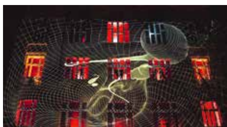
ZAHAJOVACÍ VIDEO MAPPING

Tentokrát si organizátoři pro akci vybrali jako ideální prostředí Novou strašnickou školu. Téma vzdělávání a školství doslova hýbalo letošním rokem, a tak opuštěné školské zařízení v Praze 10 představovalo jasnou dramaturgickou volbu.