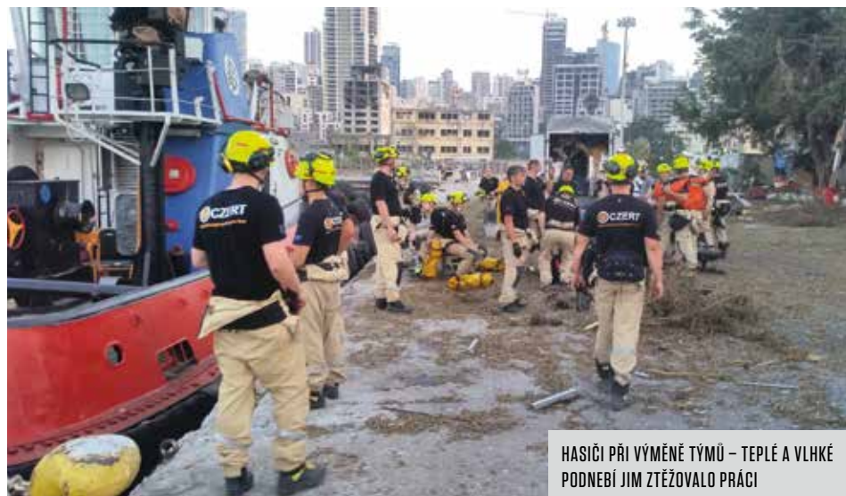
HASIČI PŘI VÝMĚNĚ TÝMŮ – TEPLÉ A VLHKÉ PODNEBÍ JIM ZTĚŽOVALO PRÁCI

Náš stát má obecně pro účely zásahu v cizině ustavený těžký USAR tým, který se skládá ze dvou středních. Jeden z nich zabezpečují členové pražského Hasičského záchranného sboru, na nichž právě ležela odpovědnost tentokrát. Zatímco příslušníci ze stanice v Sokolské ulici v rámci podobných misí vytvářejí vyhledávací skupiny a hasiči ze Smíchova se zaměřují na vyprošťování obětí a zraněných, naši z Desítky plní funkci „týlařů“ – mají na starost funkční zabezpečení záchranných akcí a tomu odpovídaly i jejich úkoly v Bejrútu.