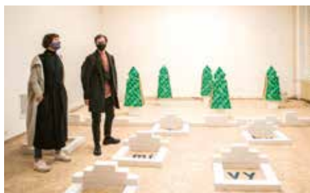
INSTALACE MILENY DOPITOVÉ