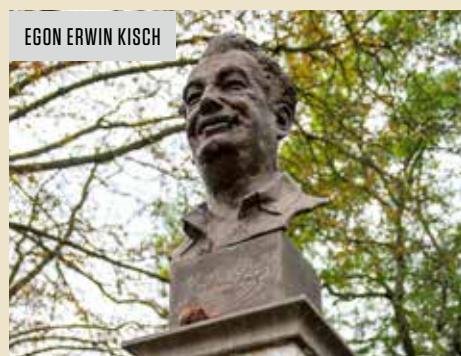
EGON ERWIN KISCH