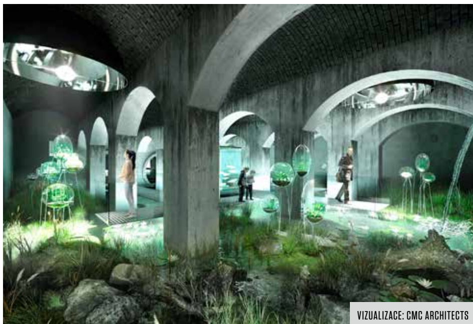
VIZUALIZACE: CMC ARCHITECTS

„Tento projekt umožní představit školám, školkám i široké veřejnosti hospodaření s vodou moderní formou.“ uvedl Petr