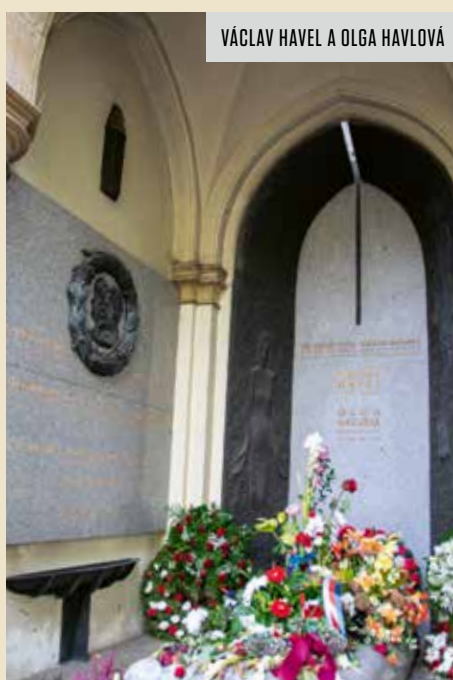
VÁCLAV HAVEL A OLGA HAVLOVÁ