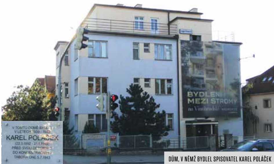
DŮM, V NĚMŽ BYDLEL SPISOVATEL KAREL POLÁČEK

Ruská ulice začíná na křižovatce Francouzské a Moskevské a vytváří severní hranici Vršovic. Tato důležitá tepna pak končí u Strašnic, kde své místo přenechává ulici Pod Rapidem. Kolem ní se nachází řada zajímavých staveb a důležitých institucí, ale dnes bych rád zmínil alespoň dvě. Jedná se o dům, který stojí na křižovatce s Bělocerkevskou. Adresa je proto někdy uváděna jako Ruská 1024/118 či Bělocerkevská 1024/40. Na tomto domě byla 19. ledna 2018 slavnostně odhalena pamětní deska, která připomíná, že zde od roku 1939 až do své deportace do koncentračního tábora 5. července 1943 žil významný spisovatel, novinář a scenárista Karel Poláček (22. 3. 1892 – 21. 1. 1945).