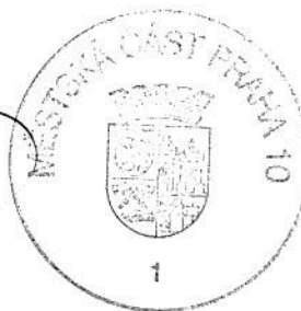
JUDr. Radmila Kleslová starostka m. č. Praha 10

Podle ověřovací knihy ÚMČ Praha 10 poř.č. vidimace 0135/2016 tato úplná kopie obsahující 1 stranu souhlasí doslovně s předloženou listinou, z níž byla pořizena, a tato listina je prvopisem obsahujícím 1 stranu. Listina, z níž je vidimovaná listina pořizena, neobsahuje viditelný zajišťovací prvek, jenž je součástí obsahu právního významu této listiny.