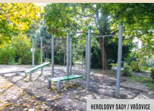
HEROLDOVY SADY / VRŠOVICE