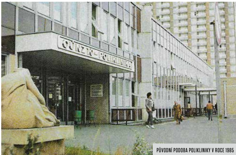
PŮVODNÍ PODOBA POLIKLINIKY V ROCE 1985

sovětského vlivu. Československý podnik zahraničního obchodu Strojexport v tomto případě domluvil dodání stavby se svým rumunským protějškem ARCOM. Partneři ze „spřátelené země“ měli původně postavit celý areál sami na klíč podle českého projektu, ale nakonec byly některé části díla ze smlouvy vyjmuty a prováděly je domácí podniky. Týkalo se to například opláštění budovy hnědočervenými boletickými panely, ale hlavní problém spočíval jinde. Rumuni měli pochybnosti o použití ocelové konstrukce, která byla pro hlavní objekt vyrobena v Sokolovských strojírnách už v letech 1969–1971. Kvůli průtahům v přípravách stavby potom musela být dlouhá léta uskladněna a nákladně udržována. Kontrolní expertiza údajně odhalila jen povrchovou korozi a prokázala, že nosné prvky nejsou oslabené, ale montáž stejně museli provést inženýři a dělníci pražské Konstruktivy.