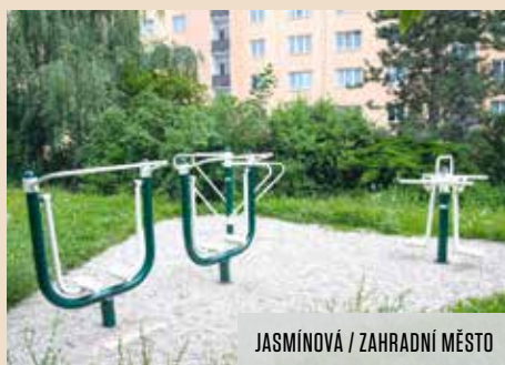
JASMÍNOVÁ / ZAHRADNÍ MĚSTO