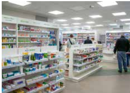
LÉKÁRNA S NEPŘETRŽITÝM PROVOZEM

Klinika má samozřejmě také vlastní radio-diagnostické oddělení a odběrové místo laboratoří. V rámci plicní ambulance zde vzniklo centrum postcovidové péče, nabízející nejrychlejší vyšetření pacientům, kteří tuto nemoc prodělali. Pro stanovení co nejlepší péče tu kladou důraz také na odhalování psychických příčin dýchacích obtíží. Ve spolupráci s městskou částí zde bylo zřízeno jedno z prvních očkovacích míst, které mohou zájemci i nadále využívat. Dohoda s radnicí stála také za zachováním pohotovostní lékárny s nonstop