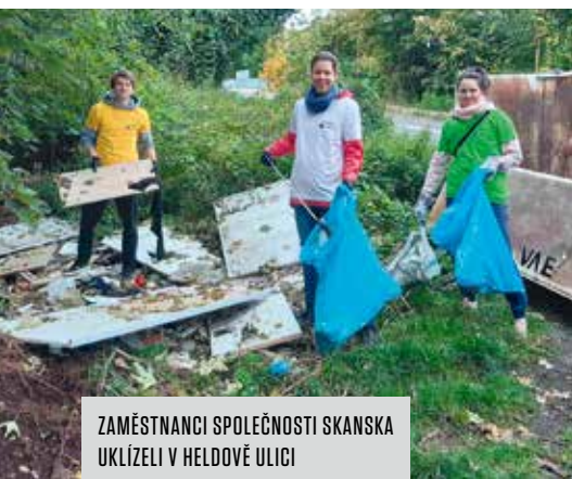
ZAMĚSTNANCI SPOLEČNOSTI SKANSKA UKLÍZELI V HELDOVĚ ULICI

Naše městská část již tradičně podpořila celostátní iniciativu zaměřenou na dobrovolnický úklid veřejných prostranství. Pod hlavičkou „Uklidme Prahu 10“ se konalo hned několik akcí, do nichž se zapojily desítky účastníků. Celkově se jim podařilo odklidit přibližně 1,8 tuny odpadu, což už je znatelná úleva pro zdejší životní prostředí. Za větší čistotu na Desítce děkujeme místním obyvatelům i organizacím, které motivovaly své zaměstnance a spolupracovníky.