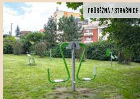
PRŮBĚŽNÁ / STRAŠNICE