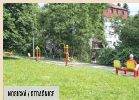
NOSICKÁ / STRAŠNICE