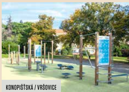
KONOPIŠTSKÁ / VRŠOVICE