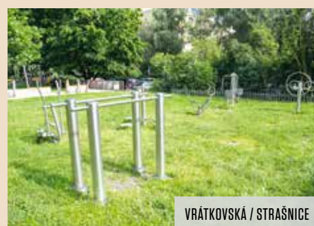
VRÁTKOVSKÁ / STRAŠNICE