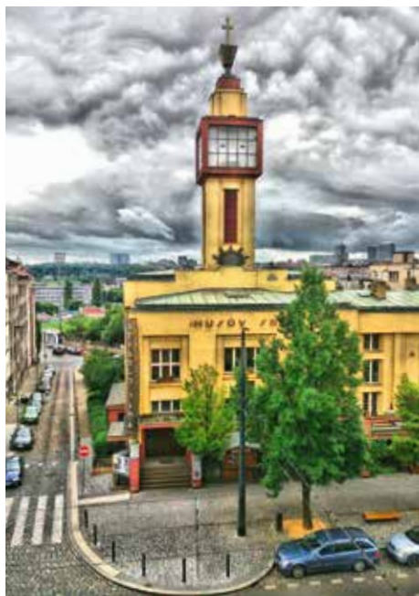
VĚŽ HUSOVA SBORU V PODOBĚ MAJÁKU NAVRHOVAL ARCHITEKT PAVEL JANÁK

Měl jsem na pracovním stole na faře urnu. Studenti medicíny nebo někteří básníci si občas své stoly krásí calvou – lebkou, která jim slouží ke studiu nebo k inspiraci, u mě na stole stála urna, abych vyřešil nerudovskou otázku „kam s ní“. K duchovní správě husitské církve ve Vršovicích přináležejí též správa kolumbária (rozumějte „urnového pohřebiště“), a tak jsem co chvíli nucen řešit nejenom otázky živých, ale i otázky mrtvých, respektive věci spojené s hrstkou prachu, která jednou zůstane z naší tělesnosti. Případ, který jsem měl řešit, nebyl nijak zvlášť složitý, šlo o to, jak do čtyřmístné schránky vměstnat další urnu, když už všechna stávající místa byla obsazena. Zadání ze strany pozůstalých znělo: „Tak dejte jednu z těch čtyř do společného hrobu.“