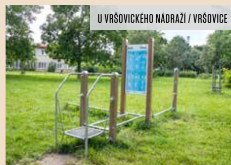
U VRŠOVICKÉHO NÁDRAŽÍ / VRŠOVICE