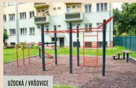
UŽOCKÁ / VRŠOVICE