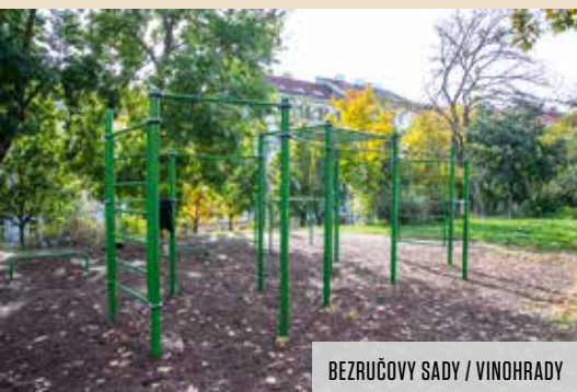
BĚZRUČOVY SADY / VINOHRADY

Určitě nás ještě čeká několik hezkých dní, kdy si můžeme vyzkoušet svou sílu, pružnost a ohebnost. Pro tento účel najdeme na Desítku spoustu vhodných míst, ať už se označují jako venkovní posilovny, fitness hřiště, nebo cvičební prvky. Představujeme vám některé z nich, určitě si vyberete. Nesedte doma, pohyb je život!