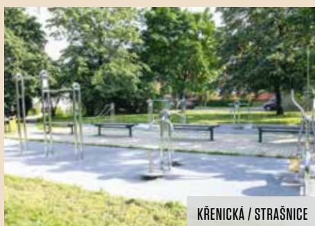
KŘENICKÁ / STRAŠNICE