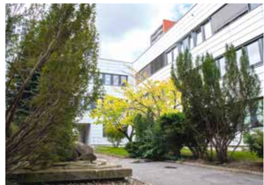
ZELENÉ ATRIUM JE NAOPAK TROCHU SKRYTÉ

Objekt polikliniky v Malešicích se začal stavět na sklonku sedmdesátých let, kdy bylo rozhodnuto o sdružení místních zdravotnických služeb pod jednu střechu. Použité technologie a materiály však zapříčinily, že budova neměla příliš dlouhou perspektivu životnosti. Už po čtyřiceti letech proto musela podstoupit rozsáhlou rekonstrukci za více než 310 milionů korun, při níž dostala zcela nové venkovní opláštění a kompletně modernizované interiéry. Objekt byl vybaven novými rozvody a přebudováno bylo i technické zázemí. Zcela zásadním počinem bylo odstranění veškerého azbestu, který se dříve používal jako protipožární ochrana v obkladech stěn.