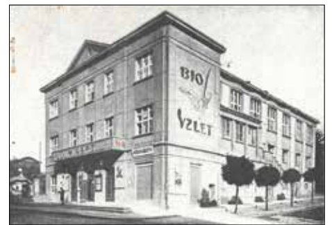
BIOGRAF NA ZAČÁTKU TŘICÁTÝCH LET