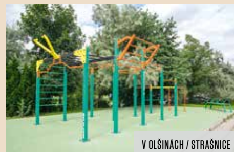
V OLŠÍNÁCH / STRAŠNICE