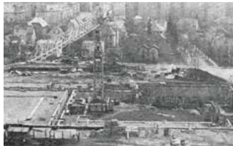
STAVENIŠTĚ V ROCE 1980