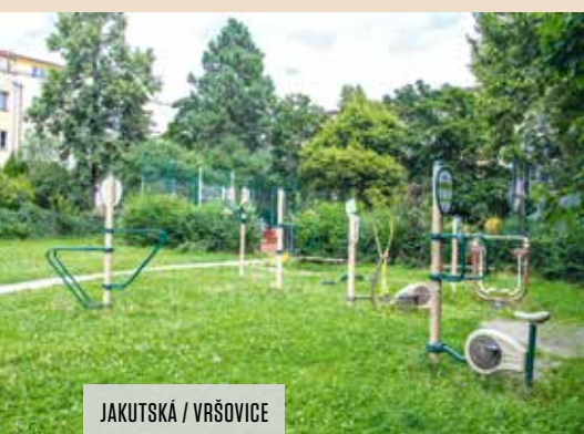
JAKUTSKÁ / VRŠOVICE