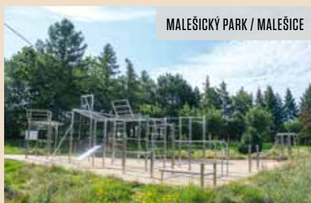
MALEŠICKÝ PARK / MALEŠICE