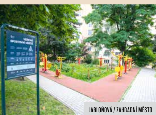
JABLOŇOVÁ / ZAHRADNÍ MĚSTO