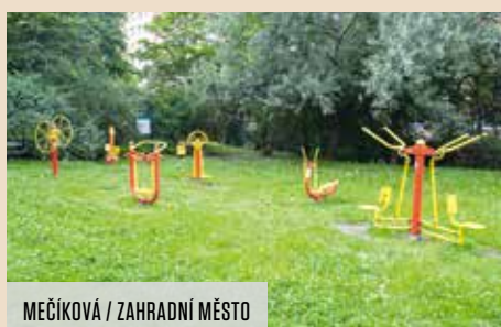
MEČÍKOVÁ / ZAHRADNÍ MĚSTO