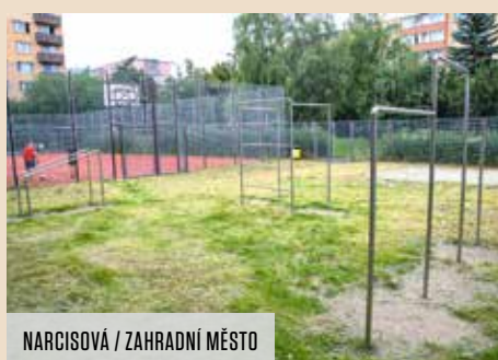
NARCISOVÁ / ZAHRADNÍ MĚSTO