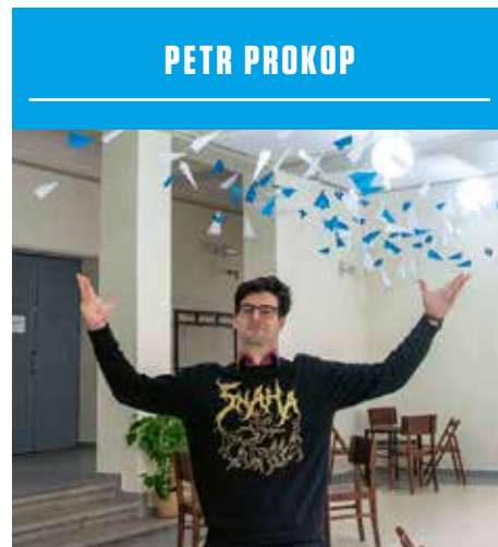
Ředitel Vzletu žije v Praze 6, kde je také zastupitelem. Vystudoval produkci na Divadelní fakultě Akademie múzických umění (DAMU) a v současnosti na tamní katedře vyučuje. V roce 1996 se podílel na založení divadla Vosto5, v němž dodnes působí jako autor a herec. Věnuje se rovněž práci producenta a produkčního – prošel projekty, jako je festival 4+4 dny v pohybu, Pražské Quadriennale, podílel se na české účasti na EXPO 2010. Byl proděkanem DAMU a předsedou Akademického senátu AMU. Ve volném čase rád běhá na lyžích a hraje lední hokej.

Když jsme zahajovali provoz, chtěli jsme ukázat, co tu budeme tvořit, a tohle výročí budeme profilovat víc do historie a komunity. Rádi bychom se trochu ohlédli a oživilli některé pozapomenuté tradice. Program poběží už odpoledne, budeme mít výtvarnou dílnu na téma místní architektury, uskuteční se vernisáž výstavy na plotě vedle Vzletu, která zahrne vzpomínky a fotografie od vršovických pamětníků, chystáme workshop staré promítací techniky a promítání zmíněného filmu s Janem Werichem. Po průvodu se ve velkém sále bude konat společenský večer se swingovou muzikou a tanečně-choreografickými vstupy, v nichž dojde i na sokolskou tematiku. ✖