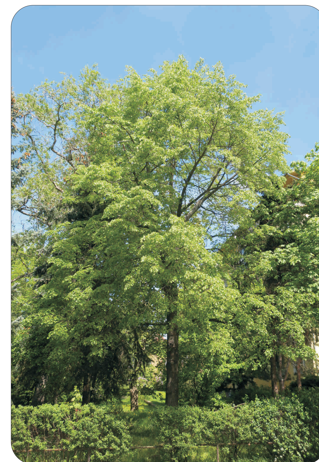
Jubilejní lípa v současnosti

V e Strašnicích při ulici Mukařovská se nachází východně od pomníku 2. světové války jubilejní lípa. Statný strom rostoucí v zápoji s dalšími dřevinami má protáhlou a relativně bohatou korunu.