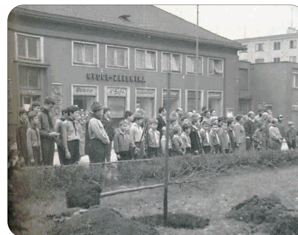
Slavnostní výsadba lípy v roce 1968

Poselství lípy zůstalo na dlouhé roky zapomenuto a její odkaz byl připomenut až v roce 2018 pamětníky akce. Věřme, že dřevina bude svoji důležitost hlásat republice po další desítky let.