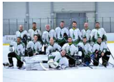
MUŽSTVO BOHEMKY NA ZAČÁTKU NOVÉ SEZONY

Je tomu devadesát let, co se Bohemians stali 33. hokejovým klubem, který byl u nás zaregistrován. Jejich úplná historie sahá ale až do roku 1907. Tehdy se však pod značkou AFK Bohemians proháněli hokejisté sice na bruslích, ale s míčkem a zahnutými hokejkami. Stejně jako jiné české týmy se na začátku 20. století sportovci věnovali bandy hokeji v dobové podobě, neboť „kanada“ tehdy byla ještě