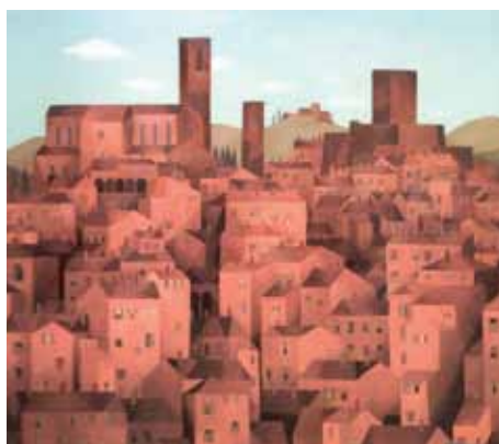
SIENA II, 1980

V jeho malbě převažují motivy krajiny – stromy, tenisové kurty na periferii, parky a zvláštní poezie městských dvorků, krajiny se statky, hladiny rybníků a figurální obrazy. Ani jeden obraz nikdy nevznikl v krajíně před motivem; všechny jsou malovány v ateliéru, kde přímý zážitek na malířův zrak už nenaléhá a kde se může volně rozvinout představa motivu oproštanovaného od všeho náhodného.