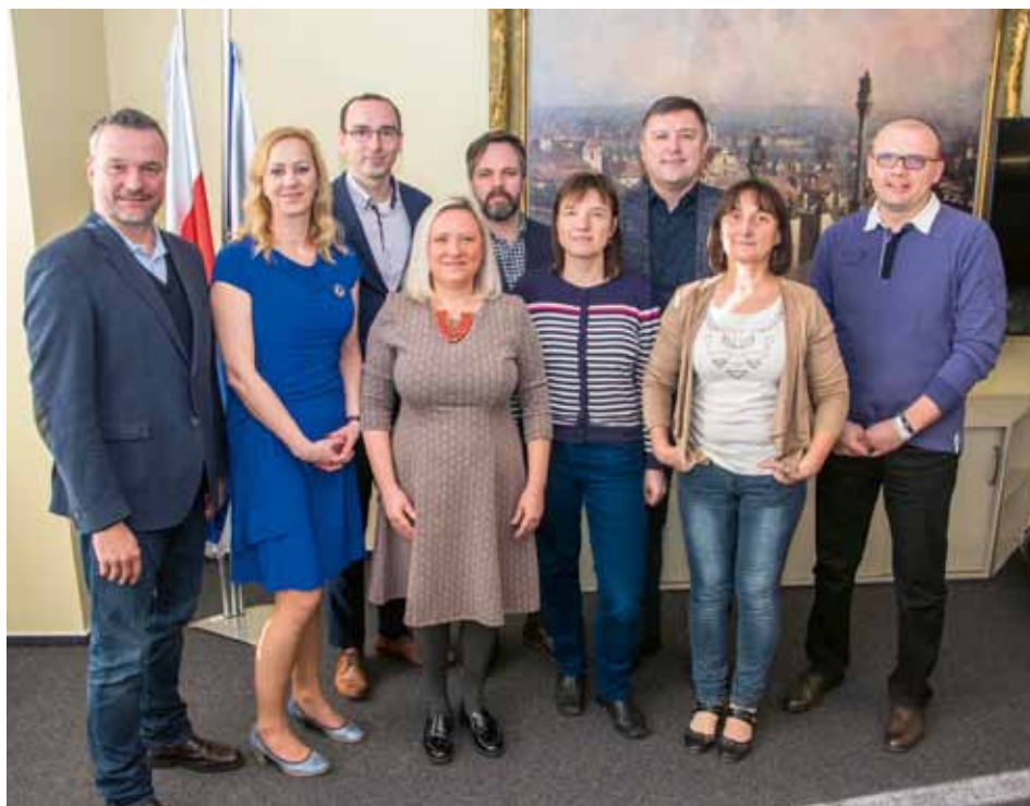
ČLENOVÉ NOVÉ RADY (ZLEVA):

V kompetenci starostky bylo obnoveno vydávání radničního měsíčníku „Praha 10“. Snahou současného vedení je, aby se informace o správě městské části a aktuality z jednotlivých čtvrtí dostávaly k obyvatelům všech generací. Začaly práce na tvorbě Strategického plánu udržitelného rozvoje Prahy 10 pro období 2020–2030. Pouze díky rovnováze v oblasti životního prostředí, ale i v rovině sociální a ekonomické se může Praha 10 stát