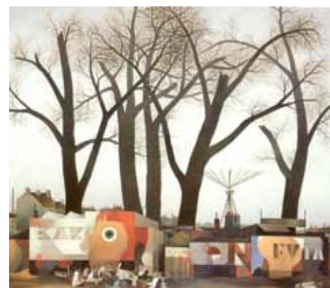
STROMY VE MĚSTĚ, 1977

V jeho malbě převažují motivy krajiny – stromy, tenisové kurty na periferii, parky a zvláštní poezie městských dvorků, krajiny se statky, hladiny rybníků a figurální obrazy. Ani jeden obraz nikdy nevznikl v krajíně před motivem; všechny jsou malovány v ateliéru, kde přímý zážitek na malířův zrak už nenaléhá a kde se může volně rozvinout představa motivu oproštanovaného od všeho náhodného.