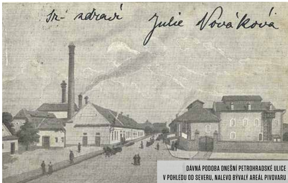
DÁVNÁ PODOBA DNEŠNÍ PETROHRADSKÉ ULICE V POHLEDU OD SEVERU, NALEVO BÝVALÝ AREÁL PIVOVARU

Osudy některých vršovických ulic jsou složité a nevyzpytatelné. Jak k tomu taková ulice přijde, když si najednou někdo usmyslí, že ji přejmenuje? Například z Přemyslovy ulice je znenadání Malšská a po čase zase Rostovská, takže se z nároží musejí pořád sundávat cedule a věšet nová označení. Lidé jsou zmatení, kde vlastně bydlí, a listonoši se snaží co nejrychleji zorientovat. Ale nejvíce je zmatená samotná ulice – ta už zkratka není, čím bývala, a chvíli trvá, než zase zjistí, kde jí hlava stojí.