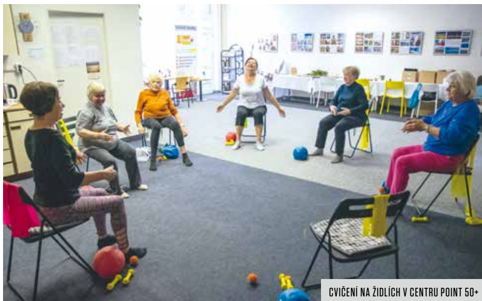
CVIČENÍ NA ŽIDLÍCH V CENTRU POINT 50+

Hodně se tu dbá na pohyb – vyzkoušejte si pilates, čínské cvičení či-gung, protáhněte se při sezení na židli nebo se přidejte k procházce po okolí, určitě se budete cítit lépe. Lekce probíhají v malých skupinkách a samozřejmě se bere ohled na vaši momentální fyzickou přípravu-