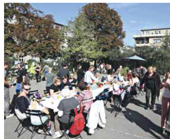
SLAVNOSTNÍ OBĚD V PARKU

Olga je otevřená i činnosti jiných subjektů, jako je místní spolek Straka, projekt Zelená desítka, Výdejna chutí, Ateliér dokumentární fotografie FAMU nebo Rytmus, který pomáhá v začleňování lidem se zdravotním postižením. Právě na základě svých pestrých aktivit získal spolek od radnice Prahy 10 nebytový prostor s podporovaným nájmem a zároveň dotaci na projekty v oblasti kultury a životního prostředí. Velkou zásluhu na životaschopnosti celého záměru mají rovněž Nadace Via a Magistrát hl. m. Prahy. Přijďte se podívat, i my se sem brzy vrátíme za novými zážitky!