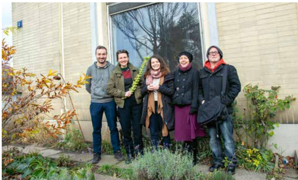
TÝM OLGY PŘED SVÝM PROSTOREM

Jak už bylo zmíněno, prostor slouží jako přirozené zázemí pro pořádání akcí v přílehlém parku. V něm se sousedé a lidé z místních občanských iniciativ setkávají například při oslavách výročí narození Františka Suchého st. (21. 6. 1899 – 23. 1. 1982). Ten kdysi tajně pořizoval seznamy popravených a zpopelněných vězňů gestapa a komunistické Státní bezpečnosti a jejich popel pietně ukládal