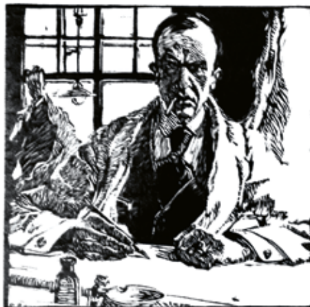
KOTĚRŮV AUTOPORTRÉT, DŘEVORYTINA, 1916

Na to nedokážu odpovědět. Líbí se mi skoro všechny jeho domy, které jsem mohla vidět. Obecně mi jeho rukopis imponuje tím, jak je celistvý, velkorysý a odvážný v celkovém pojetí a zároveň dotažený do nejmenších funkčních detailů. Taky obdivuji, jak se jeho styl vyvíjel, jak se přizpůsoboval novým impulsům a požadavkům. »