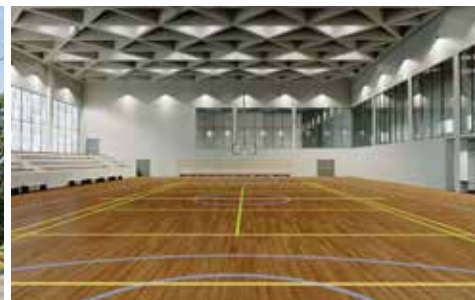
MOŽNÁ PODOBA SPORTOVNÍ HALY, VIZUALIZACE ZE STUDIE PROVEDITELNOSTI, 2021

hlediska se nicméně přímo nabízí pro výstavbu městského bytového domu s nájemním bydlením, který bude zahrnovat také významný podíl služeb. A právě takový je společný záměr hlavního města, které se s Prahou 10 podělí o bytové jednotky. Těch by tu mělo vzniknout přibližně 100 až 120. „Třicet procent z celkového počtu zdejších bytů bude převedeno do dlouhodobé správy naší městské části,“ zdůraznil místostarosta Valovič jednu z výhod pro Desítku. Dodatek k memorandu počítá rovněž s vybudováním dostatečného počtu parkovacích míst. Kapacity v Bytovém domě Vršovická budou navrženy na horní hranici dle stavební legislativy. Předpokládá se, že nad rámec potřeb budoucích nájemníků bude vytvořeno až 80 stání, která budou moci využívat i další obyvatelé Desítky.