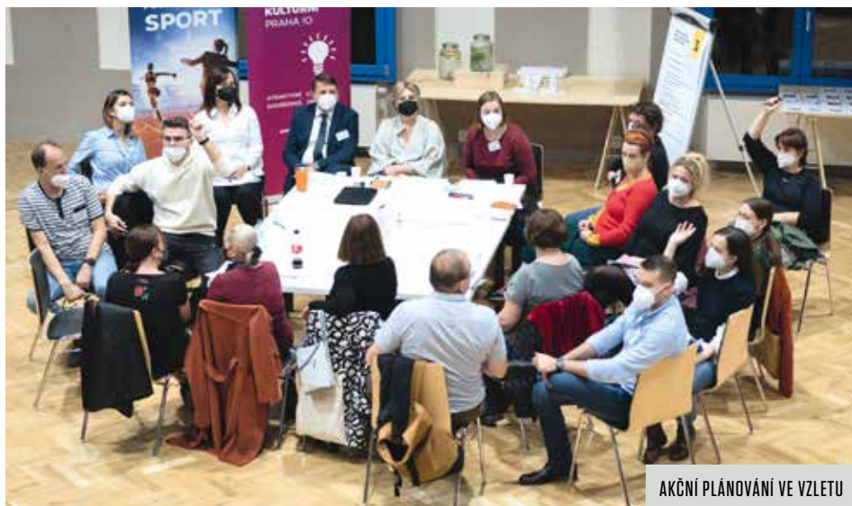
AKČNÍ PLÁNOVÁNÍ VE VZLETU

V průběhu roku jsme vypsalí osm anket, které měly poměrně příznivý ohlas a dobrou účast respondentů. Ptali jsme se vás na cyklodopravu, využívání komunitních zahrad a kompostérů, sbírali jsme data pro vytvoření studie pro území Skalky, mohli jste navrhnout název pro budoucí železniční stanici u Depa Hostivávky nebo pojmenovat parčík při vstupu do Grébovky. Mnozí z vás se vyjádřili i v rámci pocitové mapy, kterou spravuje pražský magistrát.