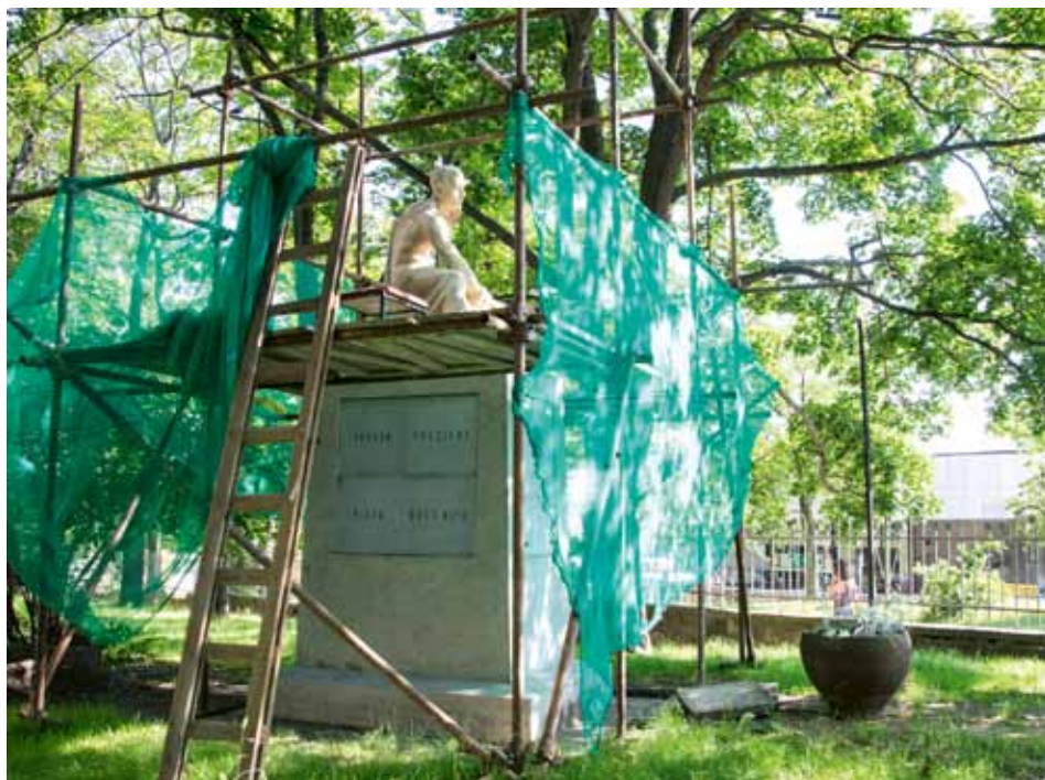
POMNÍK V PRŮBĚHU RESTAUROVÁNÍ