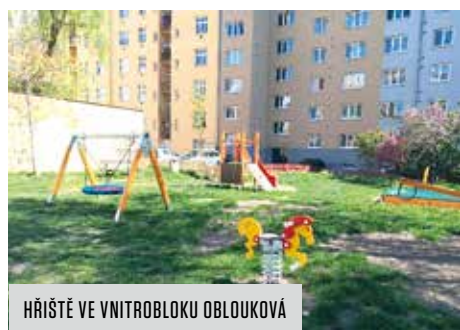
HŘIŠŤE VE VNITROBLOKU OBLOUKOVÁ

Dětské hřiště ve vnitrobloku Obloukové ulice – odstranění nevyhovujícího herního mobiliáře (pískoviště, vahadlová houpačka, pružinové houpačky), terénní úpravy a instalace nových herních prvků: pískoviště s plachtou, domečku s kreslicí tabulí, herní sestavy se skluzavkou, závěsné houpačky Hnízdo, vahadlové houpačky a dvou pružinových houpadel.