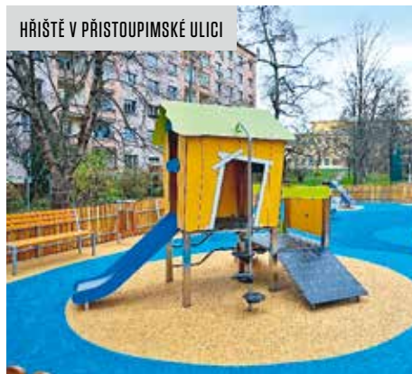
HŘIŠŤE V PŘISTOUPIMSKÉ ULICI

Dětské hřiště v Přistoupimské ulici – instalace nových herních prvků: domečku, herní sestavy se skluzavkou, trampolíny, pružinové hou-