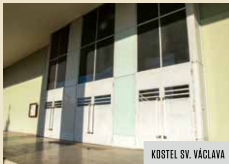
KOSTEL SV. VÁCLAVA