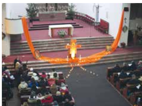
SETKÁNÍ MLADÝCH – MODLITBA TAIŽÉ

Měsíc leden je prvním měsícem v kalendářním roce a v mnoha oblastech také i novým začátkem. Máme ve zvyku si v prvních dnech a týdnech nového roku vzájemně přát šťastný nový rok. Stává se, že někdo vstupuje do nového roku s předsevzetím posunout se k nějakému dobru. Pro křesťany různých církví je měsíc leden spojen s Týdnem modliteb za jednotu křesťanů. Na začátku každého nového roku si znovu uvědomují tu bolestnou situaci, že ačkoli všichni věří v „toho Samého“, přesto nevěří stejným způsobem. Jsou mezi sebou rozdělení a nejsou jednotní tak, jak by tomu mělo být.