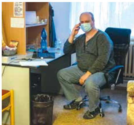
PRACOVNÍK CENTRA NA PŘIJMU

Podlouhlá přízemní budova působí omšele, kolemjdoucí by ji nejspíš minul bez povšimnu- tí. Ke vstupu ničím neláká a její nové využití signalizuje pouze nepatrná cedulka na okně. Když vejdete, pocítíte atmosféru osmdesá- tých let, kdy se nejspíš prováděly poslední rozsáhlejší úpravy interiérů včetně typického kachlíčkování veřejných sprch. Údajně zde také byly společné šatny a zázemí hospodář- ského dvora, nálepky na zadních dveřích zase dovzdělávají zašlou slávu využití objektu pro potřeby autoškoly. Naše průvodkyně nicméně vypráví, že prostory převzali v překvapivě dobrém stavu, stačilo jen pořádně vygrunto- vat. Čisto tu opravdu je, teplo také a nechybí ani nefalšované nadšení těch, kteří se o všech- no starají.