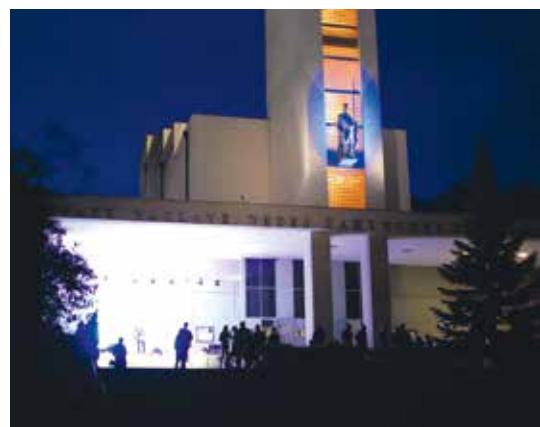
SVATOVÁCLAVSKÉ SLAVNOSTI – KONCERT V PORTIKU KOSTELA

Pro nejširší veřejnost pořádáme výstavy, komentované prohlídky, koncerty, besedy a sousedské slavnosti, jako je zářijový Svatováclavský průvod s koňmi, na Vánoce u nás můžete slyšet půlnoční „Rybovku“ nebo se sejít ke společnému zpívání koled.