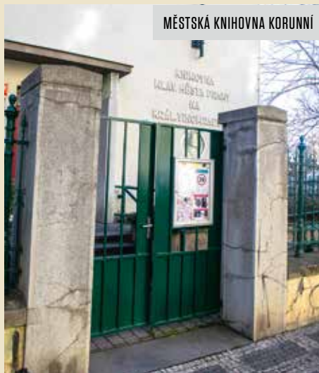
MĚSTSKÁ KNIHOVNA KORUNNÍ