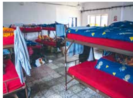
VE STŘEDISKU JSOU DVĚ NOCLEŽNÍ MÍSTNOSTI PRO 30 KLIENTŮ

si vyprat, zabavit se ve společenské místnosti a navštívit ošetřovnu, kde jim dvakrát týdně zkontrolují zdravotní stav.