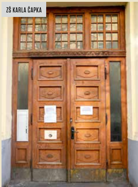
ZŠ KARLA ČAPKA