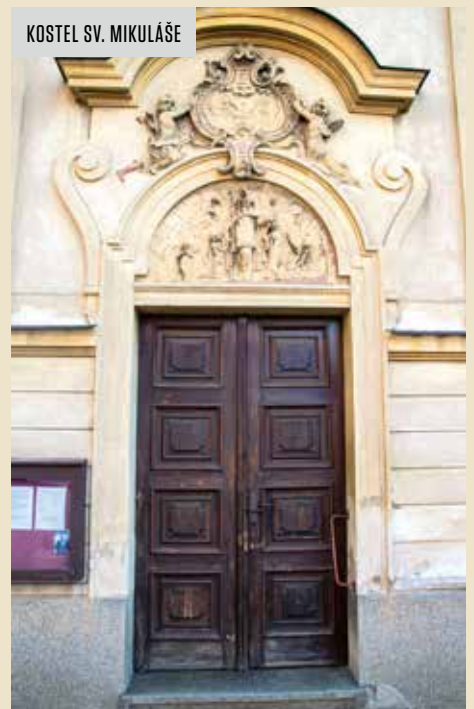
KOSTEL SV. MIKULÁŠE