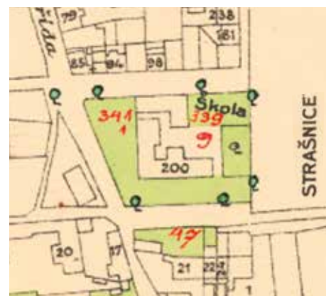
ORIENTAČNÍ PLÁN PRAHY A OBCÍ SOUSEDNÍCH 1909–1914

Noblesní stavba v sobě snoubila pokrokové konstrukční tendence, kdy se jednotlivé funkce stavby propisovaly navenek do její formy, a stylovou výzdobu, která se soustředila na použití ornamentů na fasádě a kontrasty různých materiálů. Plejáda použitých dekorativních prvků zahrnuje i figurální motivy, například zobrazení J. A. Komenského nebo dětské postavy s knihami. Objevují se i nápisy jako „Našim dětem“ nad hlavním vstupem s kovovou prosklenou markýzou nebo „Obec Staré Strašnice“ v ozdobné kartuši.