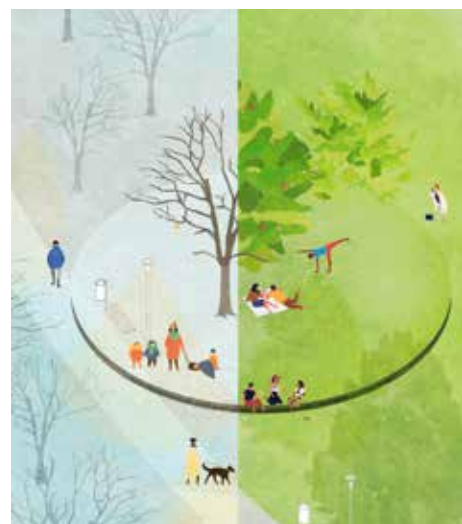
3. CENA – STUDIO COSMO