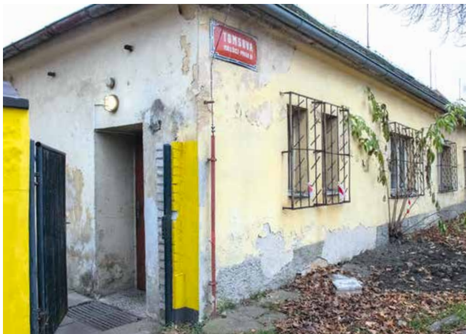
OBJEKT MALEŠICKÉHO STŘEDISKA

Technickou správu zařízení zabezpečuje Centrum sociálních služeb Praha, což je příspěvková organizace hlavního města. Samotné péči o klienty, lidi bez domova, se tu věnují pracovníci zmíněné Armády spásy a také Arcidiecézní charity. Na směnách se střídají vždy dvojice, které slouží dvanácti- hodinové směny. Středisko je totiž v provozu