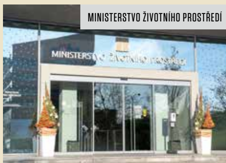
MINISTERSTVO ŽIVOTNÍHO PROSTŘEDÍ