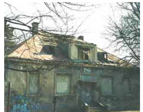
STAV BEČVÁŘOVY VILY V ROCE 2005

Ve Strašnicích patřila rodině Bečvářových také vila v ulici V Olšínách s číslem popisným 1, a to až do roku 1948, kdy byl jejich majetek vyvlastněn. Od roku 1952 v objektu fungovaly jesle, později jej začala využívat lékařská služ- ba první pomoci. Důvodem bylo, že Praha 10 se v šedesátých letech rozrostla o další obce – Horní a Dolní Měcholupy, Petrovice a Štěrbo- holy – a současně probíhala výstavba sídlišť v Zahradním Městě a Malešicích. Navíc ve školním roce 1968–1969 mělo do jeslí dochá- zet již jen 14 dětí. K plánované rekonstrukci sídlí lékařské pohotovosti však již nedošlo. Dům postupně chátral a byl v dezolátním stavu. Fotografie vily pochází z roku 2005, těsně před její demolicí. O pozemky, které se kolem vily nacházely, měla zájem městská část Praha 10, ale Ministerstvo financí je prodalo soukromé společnosti, která zde postavila bytové domy.