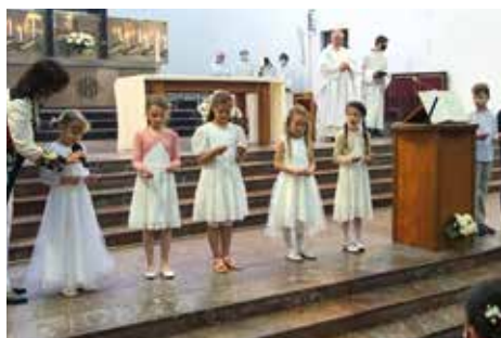
SLAVNOST 1. SV. PŘIJÍMÁNÍ – PŘÍMLUVY DĚTÍ

Rozdělení je jev, se kterým se můžeme setkat jak na úrovni rodin, které jsou rozhádané, tak u rozpadlých manželství. Vidíme rozdělenou a silně zpolarizovanou politickou scénu a také to, jakým způsobem lidi rozdělují politické názory. Rozdělené je i mezinárodní společenství. Určitě se tímto jevem někdo zabývá a prozkoumává jej. Ovšem daleko zajímavější a prospěšnější je uvědomit si následky, které rozdělení s sebou přináší, a postavit se tomuto jevu čelem. Místo abychom se zabývali otázkou „Proč“, měli bychom se spíše ptát: „Co s tím?“ Čas nám utíká, život nám utíká a mezi námi je tolik rozdělení! Samozřejmě jsme každý jiný. Máme jiné názory, jiné priority, jinou citlivost na dění kolem nás. Ale musíme se kvůli tomu na sebe dívat křivě? Musíme považovat toho, který věci vnímá jinak, za nepřítele? Žije se nám s tím lépe? A chceme žít v takové společnosti?