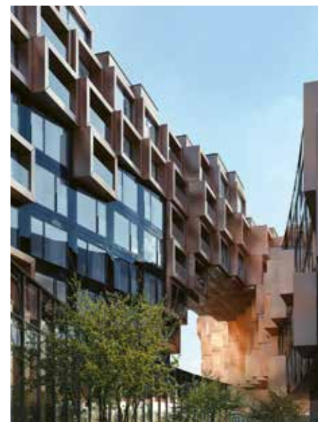
Bytový dům Fragment společnosti Trigema v pražském Karlíně.