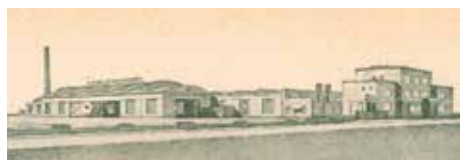
... A JEHO TOVÁRNA VE STRAŠNICÍCH