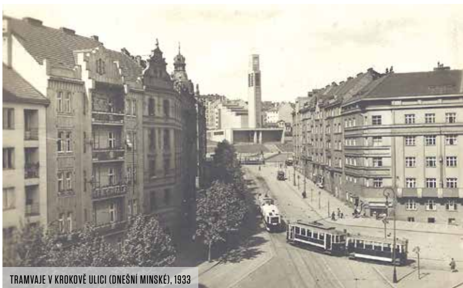
TRAMVAJE V KROKOVÉ ULICI (DNEŠNÍ MINSKÉ), 1933