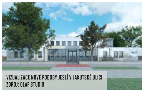
VIZUALIZACE NOVÉ PODOBY JESLÍ V JAKUTSKÉ ULICI

Dětské skupiny ve Vršovicích provozuje Centrum sociální a ošetrovatelské pomoci v Praze 10. Jsou celkem tři a navštěvuje je 56 dětí od jednoho roku do tří let. Jejich cílem je podpořit rodiny v možnostech, jak sladit pracovní a osobní život. Skupiny byly dosud k dispozici pro celoměsíční docházku i na příležitostné hlídání. „Provoz jeslí částečně dotujeme z evropských fondů. Po rekonstrukci budovy budou mít naši Motýlci, Broučci i Slu-