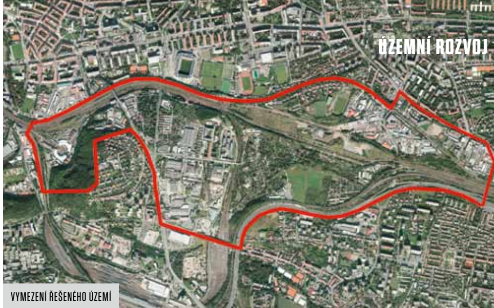
VYMEZENÍ ŘEŠENÉHO ÚZEMÍ

že dokument nechá upravit právě z hlediska rozsahu navržené zástavby a využitých kapacit. Záměrem je vytvořit podmínky pro zásadní přeměnu řešeného území na moderní městský celek v následujících zhruba 30 letech. Kapacita oblasti by se proto měla snížit na 26 000 obyvatel, což je v souladu s analýzou, kterou nedávno zpracoval Institut plánování a rozvoje hl. m. Prahy (IPR). Míra snížení odpovídá tomu, aby si oblast o celkové rozloze 184 ha zachovala městský ráz a ekonomickou udržitelnost. Tedy aby se sem vyplatilo zavést kvalitní obslužnost hromadnou dopravou a mohly zde fungovat a prosperovat obchody a služby živnostníků.