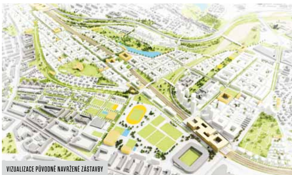
VIZUALIZACE PŮVODNĚ NAVRŽENÉ ZÁSTAVBY