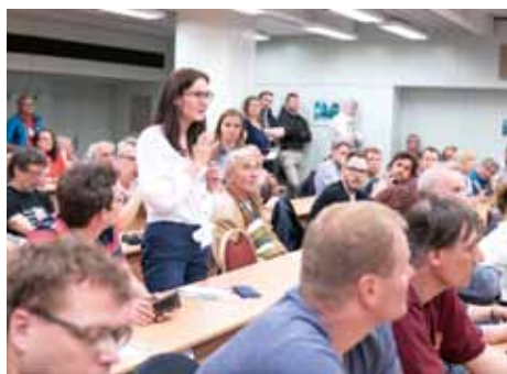
PROJEDNÁNÍ STUDIE VYVOLALO ZNAČNÝ ZÁJEM OBČANŮ

Území Bohdalce a Slatin bylo dlouhodobě zanedbávané, ale v budoucích desetiletích je neodvratně čeká bouřlivý rozvoj. Patří mezi sedm největších rozvojových zón v Praze a nové využití se hledá i pro plochy, které se uvolní redukcí seřadovacího nádraží. Uvedená studie zde dosud počítala s výstavbou nové čtvrti pro přibližně 35 000 obyvatel v horizontu 50–55 let. Současná koalice však takový záměr považuje za nadsazený a dohodla se,