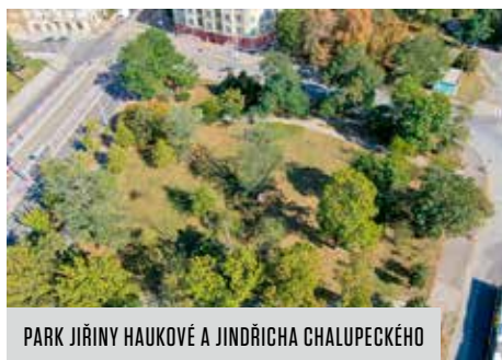
PARK JIŘINY HAUKOVÉ A JINDŘICHA CHALUPECKÉHO