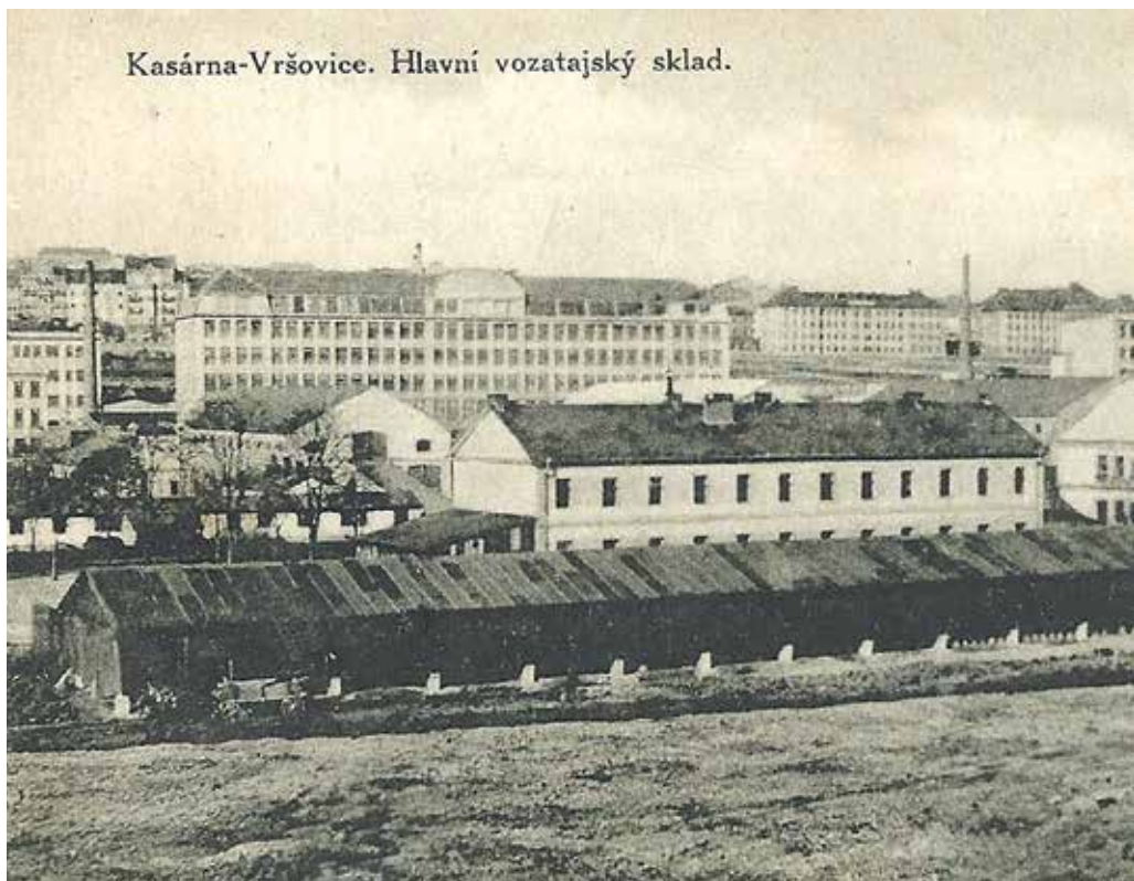
Kasárna-Vršovice. Hlavní vozatajský sklad.