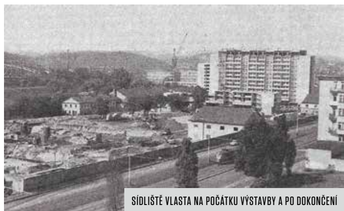
SÍDLIŠTĚ VLASTA NA POČÁTKU VÝSTAVBY A PO DOKONČENÍ