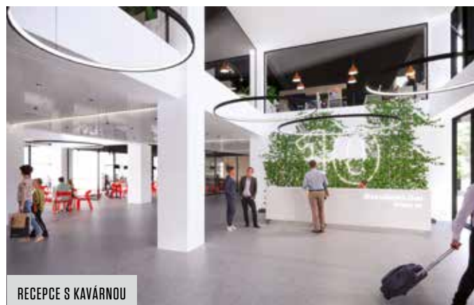
RECEPCE S KAVÁRNOU