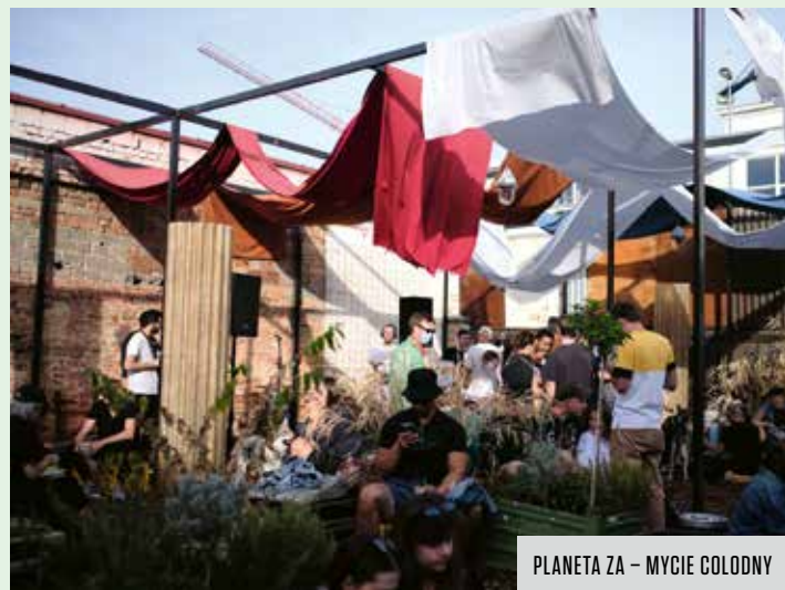
PLANETA ZA – MYCIE GOŁODNY