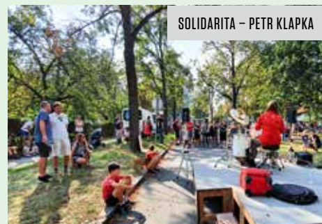
SOLIDARITA – PETR KLAPKA