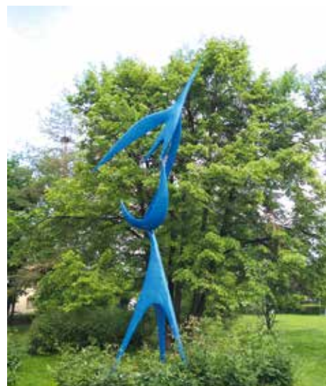
PLASTIKA „RYCHLOST“ OD JIŘÍHO NOVÁKA, U ZŠ V RYBNÍČKÁCH

existujícím dílům a zároveň přidávat záznamy o těch nově instalovaných. Archivní materiály a dokumentace ke vzniku a osazení děl jsou kusé, rozptýlené v různých zdrojích, spousta z nich je ztracena nebo uložena u soukromých osob. K mapování soch, pomníků a dalších objektů ve zdejších veřejném prostoru tak mohou výrazně přispět i pamětníci a obyvatelé Desítky.