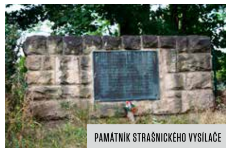
PAMÁTNÍK STRAŠNICKÉHO VYSÍLAČE

existujícím dílům a zároveň přidávat záznamy o těch nově instalovaných. Archivní materiály a dokumentace ke vzniku a osazení děl jsou kusé, rozptýlené v různých zdrojích, spousta z nich je ztracena nebo uložena u soukromých osob. K mapování soch, pomníků a dalších objektů ve zdejších veřejném prostoru tak mohou výrazně přispět i pamětníci a obyvatelé Desítky.