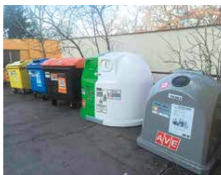
NOVÉ STANOVISŤE TŘÍDĚNÉHO ODPADU V BRAMBOŘÍKOVÉ ULICI

V uplynulém roce podala městská část na magistrát celkem 155 žádostí (zahrnujících 189 různých požadavků) na navýšení kapacity a dostupnosti sběru tříděného odpadu a zřízení dalších domovních stanovišť. V souvislosti s dokončením nové bytové výstavby vznikla tři nová stanoviště tříděného sběru, další tři byla zřízena ve stávající zástavbě – v Dykové ulici, Na Třebešíně a v Bramboříkové. Podařilo se významně navýšit počet sběrných nádob pro jedlé oleje a tuky, které přibýly na téměř padesáti místech.