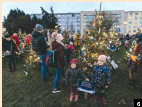
4-7 / VÁNOČNÍ STROMKY DĚTÍ Z MATEŘSKÝCH A ZÁKLADNÍCH ŠKOL, KUBÁNSKÉ NÁM.