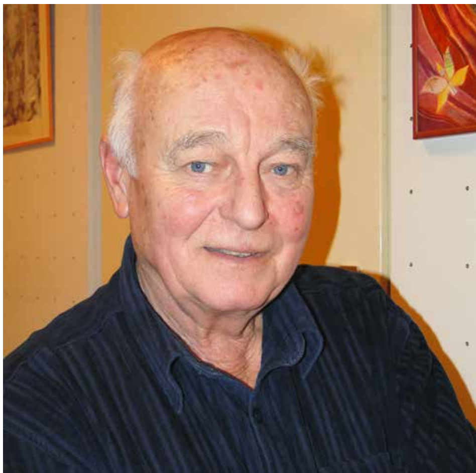
FRANTIŠEK DOSTÁL NA SNÍMKU Z ROKU 2011

malo a bavilo. V sedmdesátých letech se jeho dílo dostalo do širšího povědomí veřejnosti. Když mu bylo vytýkáno, že jeho tvorba není vhodná k vystavování, přesvědčil všechny o pravém opaku – během několika let se zúčastnil desítek výstav po celém světě. Jeho fotografie byly zastoupeny i ve dvou ročnících soutěže World Press Photo.