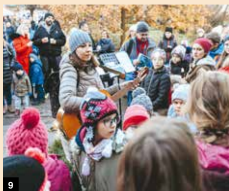
9-10 / ROZSVĚCENÍ STROMU V MALEŠICÍCH