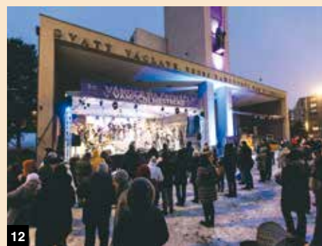
11-13 / VÁNOČNÍ MĚSTEČKO NA ČECHÁČI