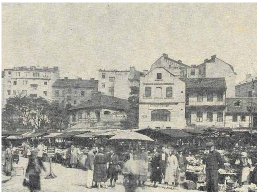
NĚKDEJŠÍ VRŠOVICKÉ TRŽIŠTĚ

Jenže než se naše ulice stala Charkovskou, nesla od přelomu 19. a 20. století své první jméno podle Jana Nerudy (1834–1891), věhlasného prozaika, básníka a novináře. Narodil se v Praze na Malé Straně do chudých poměrů. Jeho otec, vysloužilý voják, měl trafikou a matka pracovala jako posluhovačka. Neruda absolvoval malostranské gymnázium, ale následná studia práv a filozofie na univerzitě přerušil, neboť musel zabezpečit rodinu. Stal se novinářem a tomuto povolání se věnoval celý život. Byl redaktorem deníku Čas, poté přešel do Hlasu a od roku 1865 byl až do své smrti spjatý s Národními listy, pro které napsal přes dva tisíce fejetonů. Kromě toho založil týdeník Květy a přispíval do časopisu Lumír. Podílel se na vydání almanachu Máj, který představil novou generaci autorů. Sám stanul v čele této literární skupiny, kterou známe jako tzv. májovce. Je autorem i několika básnických sbírek, jako první vyšlo „Hřbitovní kvítí“, následovaly „Knihy veršů“, „Písňe kosmické“, „Balady a romance“, „Prosté motivy“ či „Zpěvy páteční“. Vytvořil také několik povídkových souborů, jako jsou „Arabesky“ nebo „Povídky malostranské“, jeho asi vůbec nejslavnější dílo.