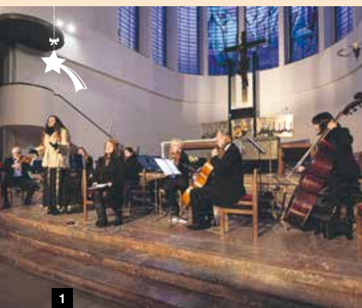
1-3 / VÁNOČNÍ KONCERT KLASICKÉ HUDBY V KOSTELE SV. VÁCLAVA

Čas čekání na betlémskou hvězdu a vánoční naději jsme si po dvou letech konečně zase naplno užili. Ke kouzelné adventní atmosféře přispělo také několik akcí, které pro veřejnost připravila městská část, v některých případech společně s místními občany nebo kulturními organizacemi. Rozsvítili jsme několik vánočních stromů a hlavní událostí bylo premiérové Vánoční městečko na náměstí Svatopluka Čecha. Snad si přátelská setkání, dobrou náladu a rozzářené oči z těch dní uchováme i v novém roce.