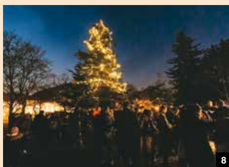
8 / SETKÁNÍ U VÁNOČNÍHO STROMU NA SOLIDARITĚ