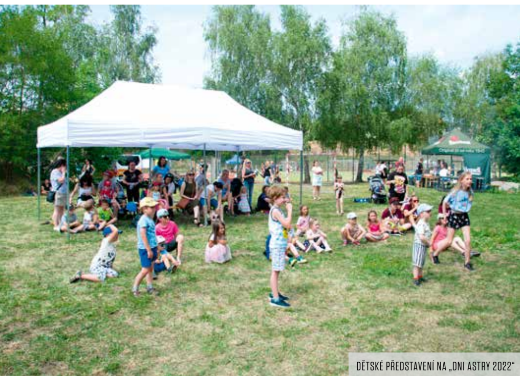
DĚTSKÉ PŘEDSTAVENÍ NA „DNI ASTRY 2022“

Neznamená to ovšem, že by Astra byla jen pro vyvolené. Naopak, současná vedení se jednotu snaží co nejvíce otevřít. Zaměřují se tady především na práci s dětmi, zejména ve věku od 6 do 18 let, které tvoří dvě třetiny sportovní základny. Podle Moniky Wachsmannové je dětí na sídlišti pořád hodně, navíc přibývá nová zástavba a v okolí je i několik škol. „Především chceme, aby se děti začaly jakýmkoliv způsobem pohybovat. Proto začí-