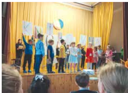
CELOŠKOLNÍ WORKSHOP K MOJÍ STOPĚ NA ZŠ U VRŠOVICKÉHO NÁDRAŽÍ

počítá s termínem na jaře a každá škola na ni dostane příspěvek od městské části ve výši 35 000 korun.