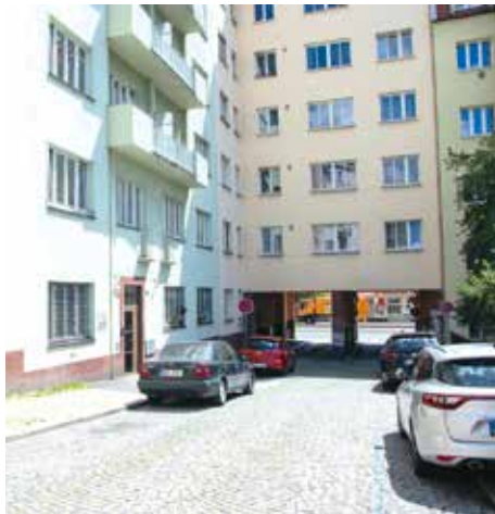
ČELJABINSKÁ ULICE ÚSTÍ PRŮJEZDEM DO VRŠOVICKÉ

Narodil se 24. února 1928 v Novém Městě nad Metují, později absolvoval gymnázium v Náchodě a vystudoval Přírodovědeckou fakultu Univerzity Karlovy v Praze. Od roku 1952 pracoval v Ústředním ústavu geologickém (později Český geologický ústav) a od roku 1968 byl externím docentem na pražské univerzitě. Zabýval se periglaciální geomorfologií, kryogeologií a širší problematikou velehorských oblastí.