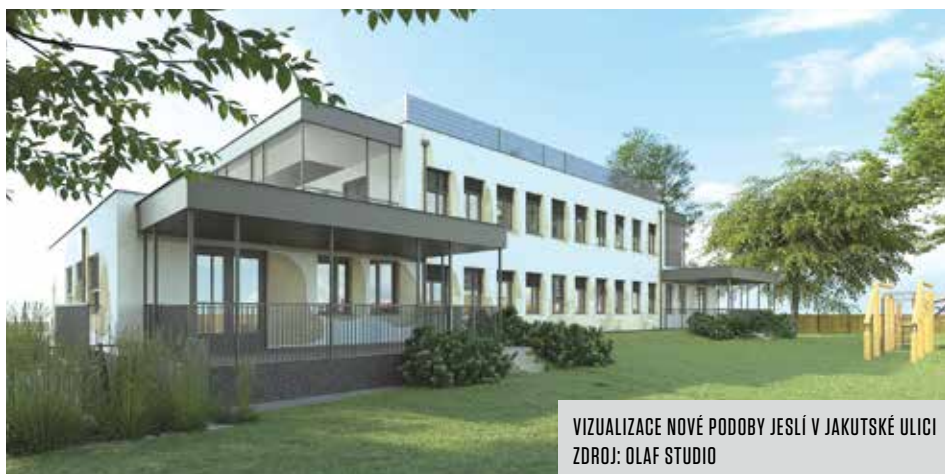
VIZUALIZACE NOVÉ PODOBY JESLÍ V JAKUTSKÉ ULICI

Cílem dětských skupin je podpořit rodiny v možnostech, jak sladit pracovní a osobní život. Tři skupiny v Jakutské ulici byly dosud k dispozici pro celoměsíční docházku i na příležitostné hodinové hlídání.