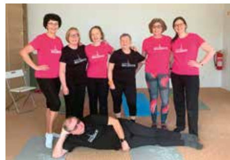
RANNÍ CVIČENÍ S FYZIOTERAPEUTKOU

Paní zástupkyně tak trochu opravuje všeobecné vnímání Jablíčkova jako „sranda zábavy“ pro rodiče s dětmi: „Máme dopolední i odpolední programy pro rodiče s dětmi i děti samotné, ale přesně víme, co a proč v nich děláme. Za tím vším je velmi propracovaná metodika a silný tým zkušených lektorů. Na ně pak navazuje tým odborných poradců. Rádi bychom proto zvýšili povědomí o našem odborném zázemí a vzdělávacích činnostech.“