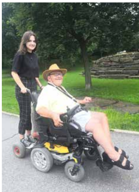
DOBROVNICE ARCHY POMOCI S KLIENTEM NA PROCHÁZCE V PARKU

Dobrovolníkem se může stát kdokoli. Třeba i senior, který se také cítí osamělý, ale má stále dost sil zajít za druhým člověkem a příjemně s ním strávit čas například společným povídáním, procházkou nebo poslechem