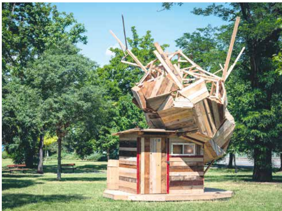
PETR STIBRAL, POMNÍK ZAHŘÁDKÁŘSKÉ KOLONII NA SLATINÁCH, FESTIVAL M 3 / UMĚNÍ V PROSTORU

Chtěl jsem udělat jakýsi sochařský znak-embém charakterizující zahrádkářské kolonie. Definoval jsem si, že nezbytným archetypem jsou bouda, strom a sud na vodu. S tím jsem pracoval sochařským pomnikovým způsobem, včetně tradičního podstavce. Z pohledu významu je to manifest proti nesmyslnému zastavování zelených míst v Praze špatnou zástavbou. Je zřejmé, že nás prostředí, proporce, tvary a barvy věcí i architektury