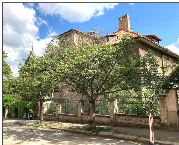
Stromy č. 4 a 5 u Kotěrovy vily