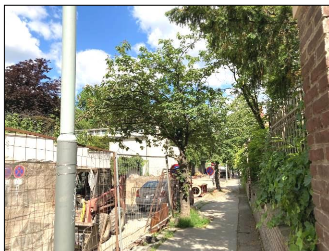
Stromy č. 13 a 14