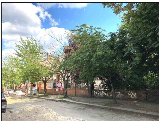
Stromy č. 7 – 10