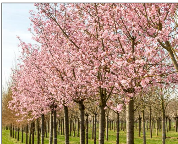
Třešně Sargentovy v květu

Stromy budou sázeny ve velikost B16-18 (stromy se zemním balem s obvodem kmínku 16-18 cm v 1 m výšky). Stromová mísa bude opatřena mlatovým povrchem.