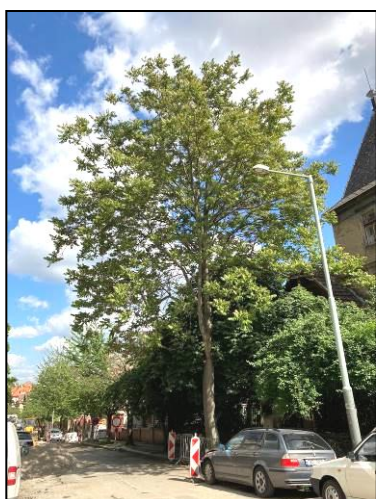
Pajasan žláznatý č. 6