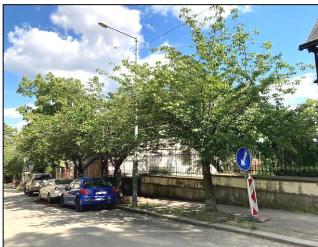
Stromy č. 1 – 3