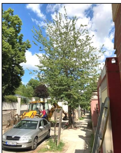
Nová výsadba č. 11 a třešeň ptačí č. 12 – byla pokácena