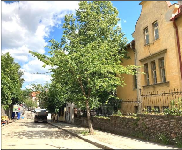
Stromy č. 15 a 16