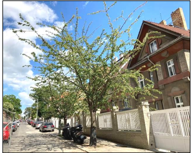
Stromy č. 17 a 18