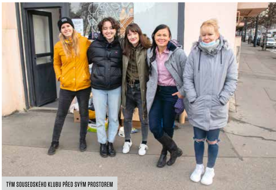
TÝM SOUSEDSKÉHO KLUBU PŘED SVÝM PROSTOREM

Domluvila se proto přes Potravinovou banku s místním Teskem, které jí začalo poskytovat jídlo interně určené k vyhození. Jedná se o výrobky, které jsou z reálného pohledu v pořádku, jen mají třeba poškozený obal nebo prošlé datum spotřeby. Zuzana začala jídlo rozvážet starým lidem v nouzi, které znala ze sousedství, a zároveň se doptávala na další potřebné z okolí. Ve volném čase tímto způsobem pomáhala asi dva roky, ale počet klientů narůstal