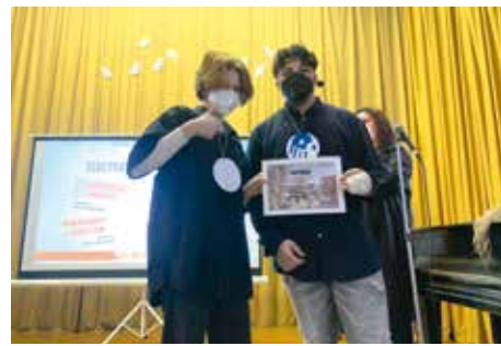
WORKSHOP K PROJEKTŮM MOJÍ STOPY V ZŠ BŘEČŤANOVÁ

V Edenu na to šli pěkně genderově vyváženě a zvolili si jeden projekt pro holky a jeden pro kluky. Hoši dostanou nový stolní fotbalík , děvčata si na chodby vybrala malé variabilní barevné sezení v jednotlivých patrech. Nápady vzešly z hodin etické výchovy.