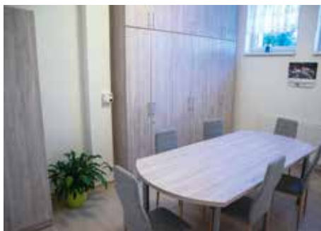
SBOROVNA S ARCHIVEM

Kromě obnovy zmíněné technické infrastruktury včetně elektroinstalace se také vyměňovaly koberce a jiné podlahové krytiny, interiéry dostaly novou výmalbu. Všechny tři třídy získaly dostatečně velké a moderní toalety. Zásadním počinem byla dostavba dvou krajních pavilonů, díky níž vznikly potřebné prostory. K oranžovému pavilonu přibyla rozlehlá ředitelna a místnost pro uložení administrativních archiválií, které dříve dětem zabíraly plochu pro hraní. Zároveň se tady u širokého stolu mohou konat různá jednání s větším počtem účastníků. Paní ředitelka Ludmila Poršová si nastalou situaci velice pochvaluje: „Předtím jsme tady byli opravdu stísnění. Například i přijímací řízení jsme vyřizovali mezi hrajkami si dětmi. Konečně máme možnost občas se trochu nadechnout.“