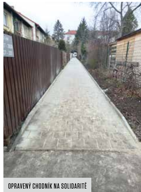
OPRAVENÝ CHODNÍK NA SOLIDARITĚ

Praha 10 začala nově financovat opravy chodníků ze svého vlastního rozpočtu. Dosud fungovala praxe, že se o chodníky městské části staral magistrát prostřednictvím své organizace Technická správa komunikací (TSK). Pilotní projekt dokončila radnice už v prosinci ve Strašnicích.