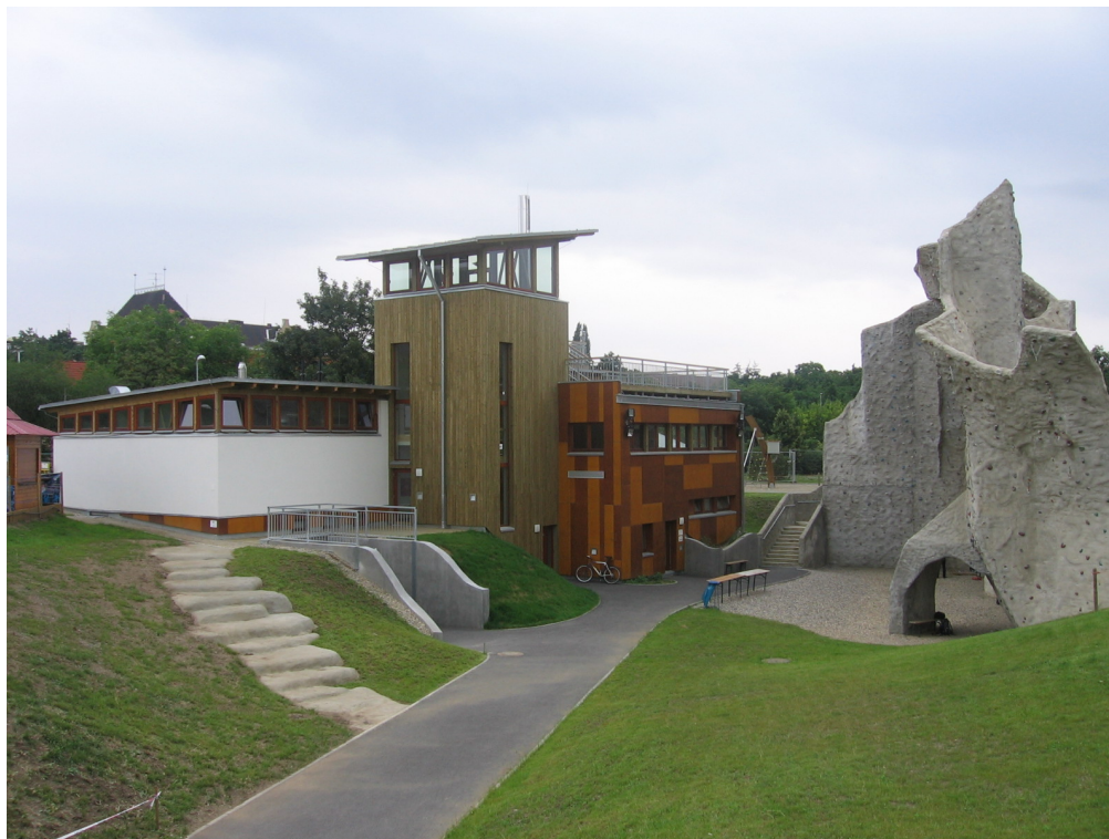
Areál volného času Gutova

Do areálu Gutovka a tedy i do vodního světa se v roce 2008 nevybíralo vstupné, neboť je jeho provoz hrazen z rozpočtu radnice Prahy 10.