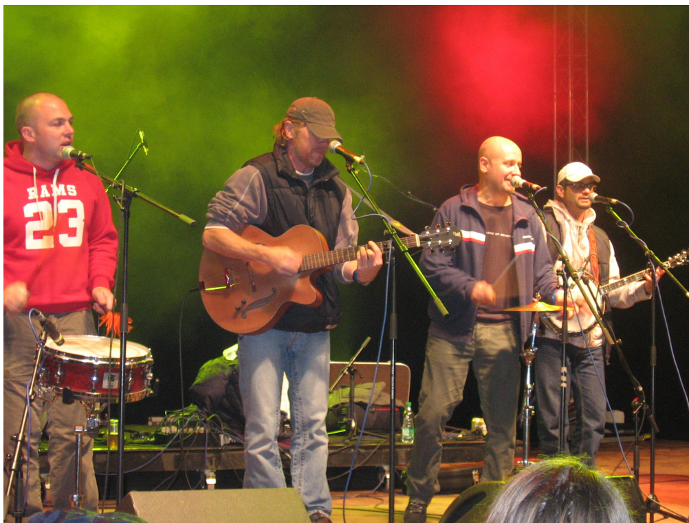
Závěrečný koncert 10 dní Prahy 10 v podání skupiny Děda Mládek Illegal Band