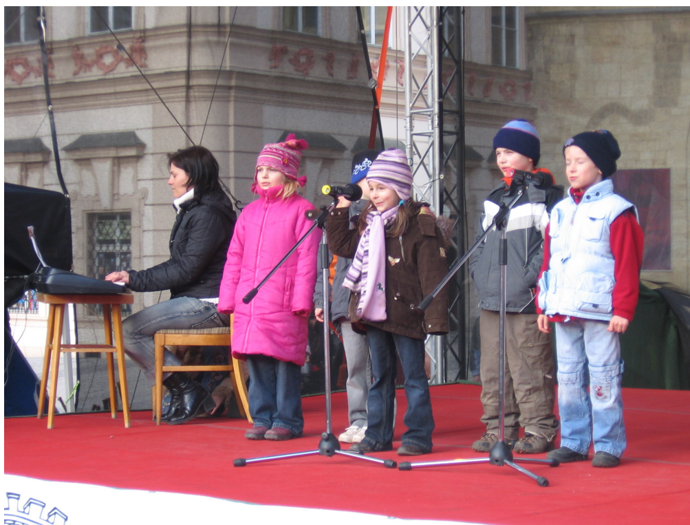
Vystoupení dětí z Prahy 10 na Staroměstském náměstí

16.50 - 17.00 Základní škola Hostýnská 17.00 - 17.15 Dům UM - taneční kroužky domu dětí a mládeže (Rock and Roll, Hip-hop, Dance unlimited, orientální tance) 17.15 - 17.30 Žesťové kvinteto Základní umělecké školy Bajkalská 17.30 - 17.40 Tělovýchovná jednota Sokol Strašnice 17.40 - 17.50 Kytarové duo 17.50 - 18.20 Taneční skupina DIXI 18.20 - 18.50 POP BALET - Taneční škola InDance