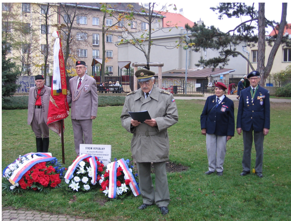
Slavnostní položení věnců proběhlo v Praze 10 i při příležitosti 28. října

Proslavil se desítkami rolí, hrál například ve filmech Byl jednou jeden král, Čtyři vraždy stačí, drahoušku, Saturnin a v mnohých dalších. Díky svému výraznému komickému talentu byl pravidelně obsazován do rozhlasových a televizních zábavných programů, hlavně pak do silvestrovských pořadů.