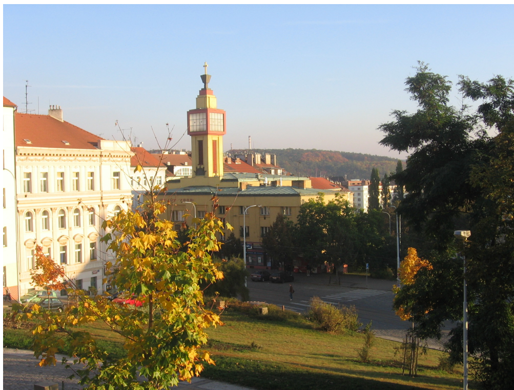
Husův sbor Vršovice – pohled od Rangherky

Sborové snídaně v Husově sboru - konají se pravidelně každou druhou neděli v měsíci od 8. 30 hod.