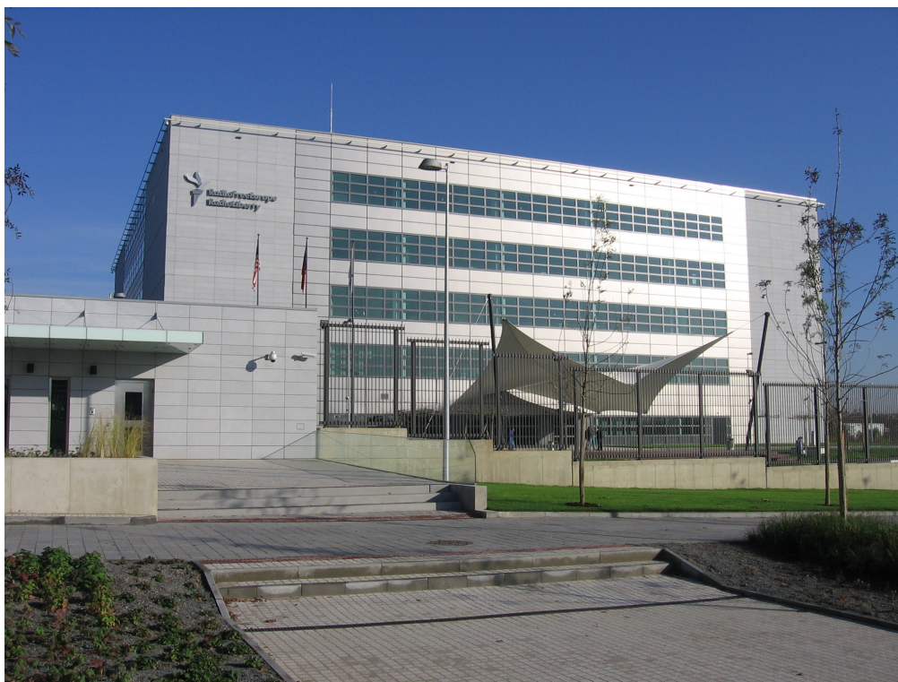
Rádio Svobodná Evropa

Stavba je navržena tak, aby chránila zaměstnance rádia, ale aby jim poskytovala i příjemné pracovní prostředí. Jsou zde špičkově vybavená studia a kanceláře, přičemž studia jsou vždy v rozích budovy tam, kde nejsou okna. V bočních částech jsou rozlehlé kanceláře - v otevřených prostorách budou současně pracovat desítky lidí. Uprostřed budovy, v proskleném atriu, vznikl supermoderní "newsroom", kde se budou scházet příspěvky od zpravodajů z celého světa. Atrium má otevřený prostor až po prosklenou střechu, kudy na redaktory dopadá denní světlo. Rádio má dva vlastní generátory pro případ, že by vypadl proud. Ten druhý je tady proto, kdyby úplně v nejhorším případě vypadl i první generátor, což je ale prakticky nemožné.