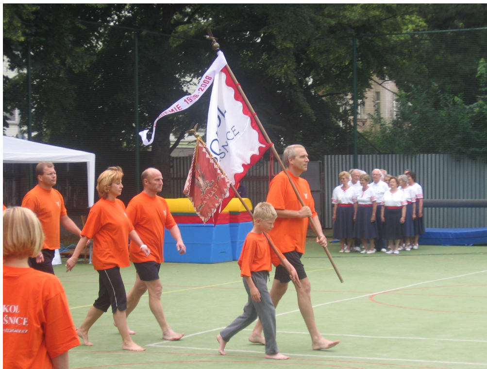
Oslava stého výročí založení Sokola Strašnice

TJ SOKOL Praha Strašnice se nachází na adrese Saratovská 4/400, Praha 10 - Strašnice