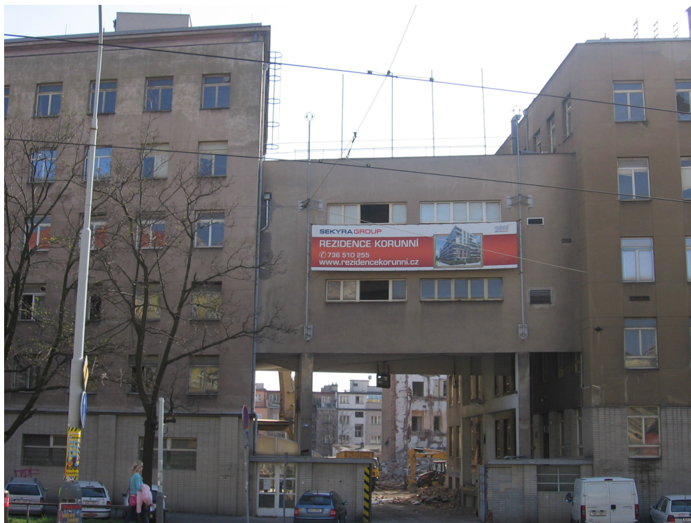
Místo těchto domů vzniká Rezidence Korunní

Internetové stránky jsou http://www.bytyustatku.cz/o-projektu.php .