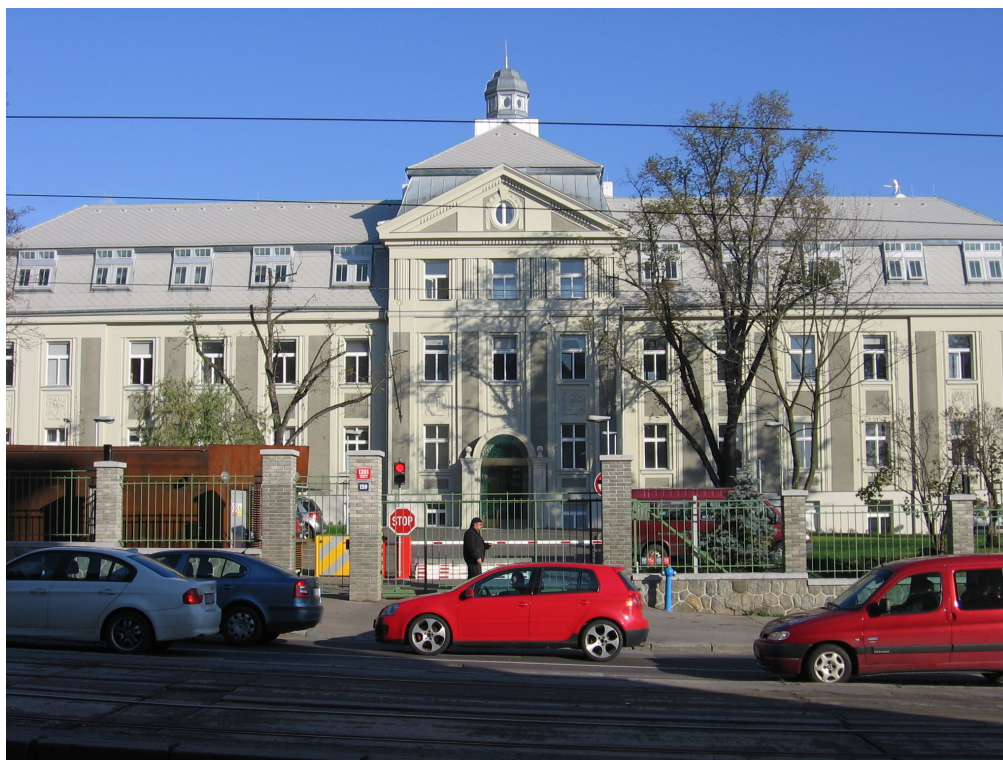
Domov sociální péče Hagibor

na trase Ládví - Letňany a nový fotbalový stadion SK Slavia Praha v Praze 10, který je kromě stadionu doplněn také administrativní, ubytovací a technickou částí i komerčními prostorami.