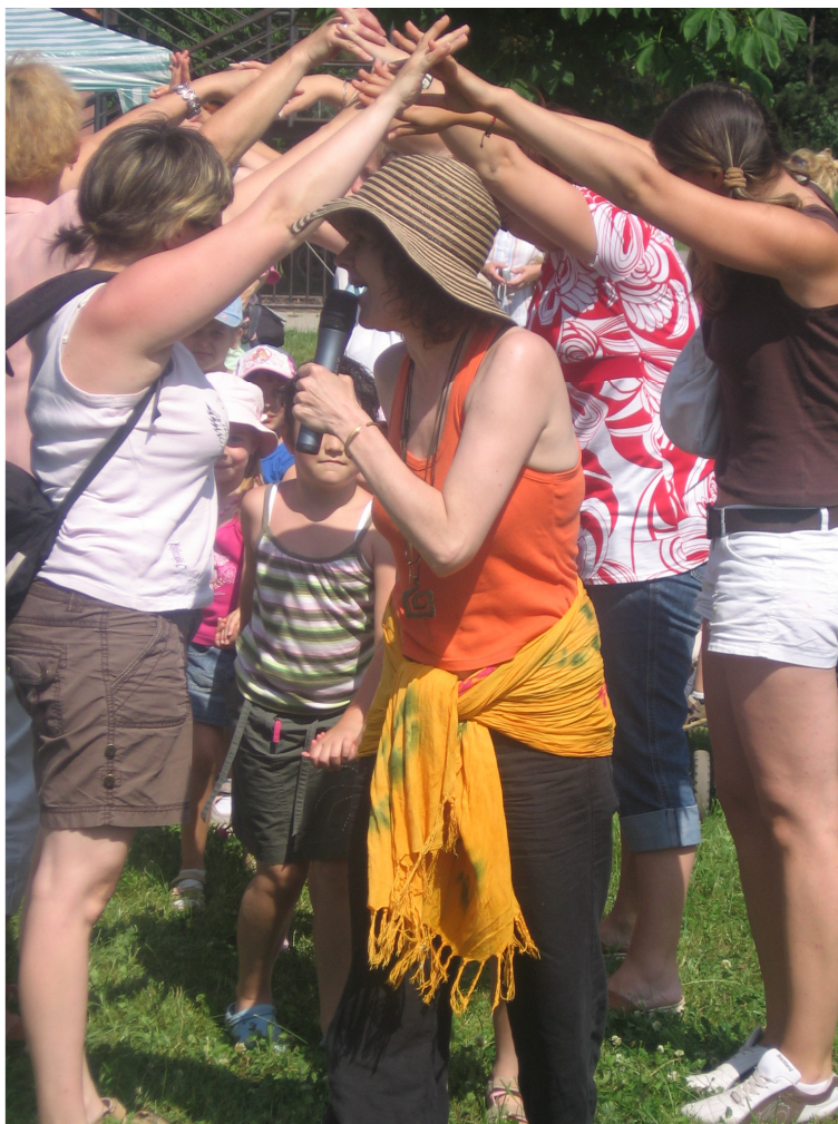
Den dětí Prahy 10

Organizátorům se ve spolupráci s agenturou Jidáš se podařilo zajistit nejen bohatý program, ale i krásné počasí, proto se nelze divit, že se zde během odpoledne vystřídalo přes 400 dětí.