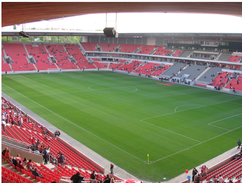
Nově otevřený fotbalový stadion v Edenu

Konstrukčně projektanti položili celou stavbu na 603 podpěrných betonových pilotů a jde tak o kombinaci prefabrikované a monolitické konstrukce. Střeška váží 1300 tun a podhledy jsou z kanadského cedru, jehož stáří je od třiceti do sta let. Stadion je obložený laminátovými deskami v imitaci dřeva s dvěma odstíny hnědé v kombinaci s červenou.