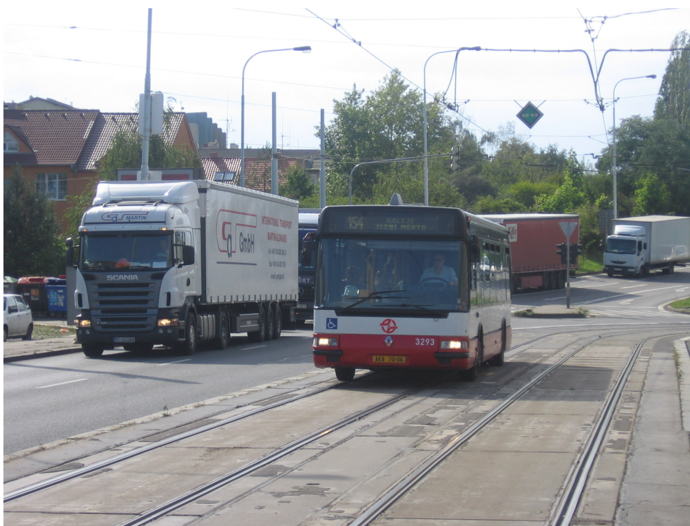
Při opravě lanového mostu jezdily autobusy po kolejích a nákladní auta stála v kolonách

Když si řidiči na tuto obtížnou situaci zvykli, přišla Technická správa komunikací s tím, že na tři dny zavírá lanový most úplně. Bylo to, bohužel, nezbytné kvůli zajištění stoprocentní kvality při opravě. Celková uzavěra mostu se snížila na technologické minimum a naplánována byla z větší části na víkend, kdy je provoz osobních i nákladních automobilů slabší. Lanový most byl uzavřen v obou směrech ve čtvrtek 21. srpna ve 23 hodin a auta se měla vrátit až o půlnoci 24. srpna.