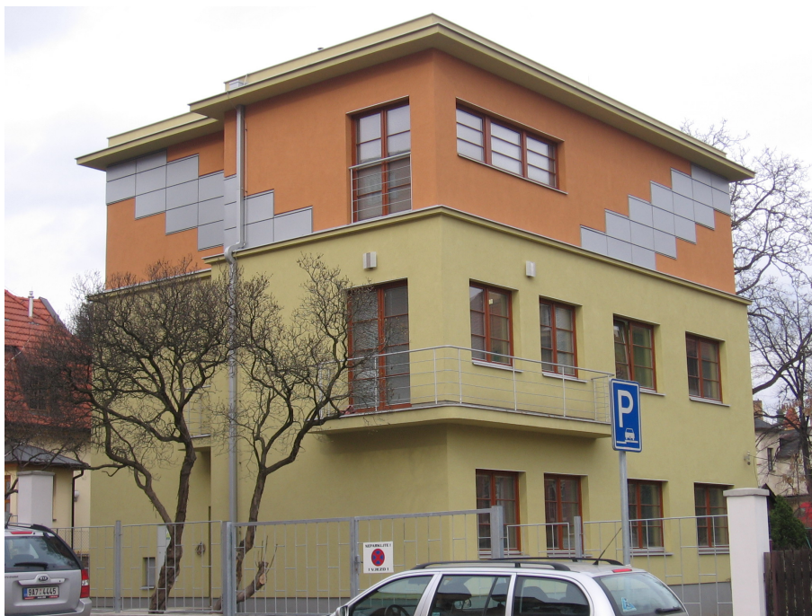
Dům zubní péče o děti a rodinu

Kontakt do ordinace v pracovní době je 733 15 15 15.