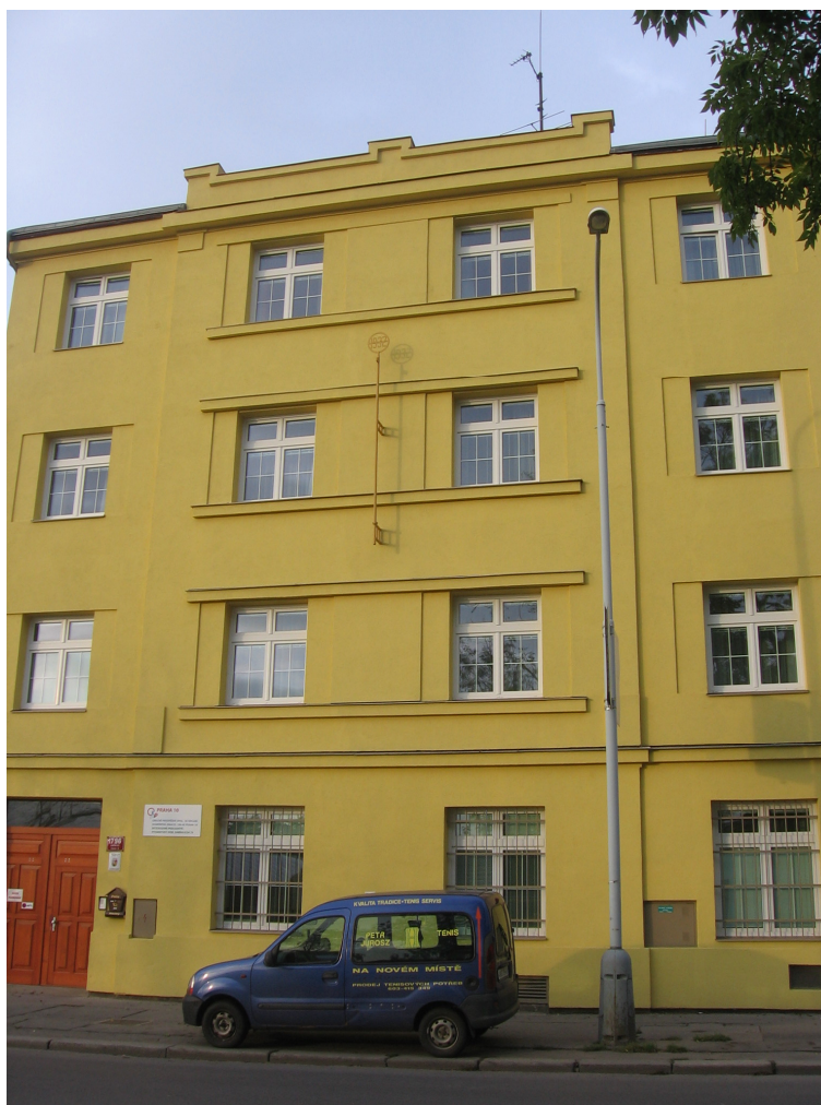
Studentský dům v Záběhlicích

Vedení radnice Prahy 10 se rozhodlo pomoci dospívající mládeži z dětských domovů a na svoje náklady obec opravila zdevastovaný dům v Záběhlické ulici, který má sloužit jako studentský dům – kolej. Podmínkou je, že studenti musí mít maturitu a musejí mít zájem studovat na Vysoké škole finanční a správní. Studenti si mohou vybrat ze dvou oborů – veřejná správa a marketingová komunikace. Projekt je zaměřen pro žáky, kteří odcházejí z dětského domova či obdobného zařízení nebo kteří prošli náhradní rodinnou péčí. Každoročně vyjde v Praze 10 z dětských domovů asi deset mladých dospělých lidí, proto se jim radnice rozhodla tímto projektem pomoci. Nejde však jen o dospívající mládež z Prahy 10, ale radnice chce takto podpořit všechny talentované lidi z celé republiky.