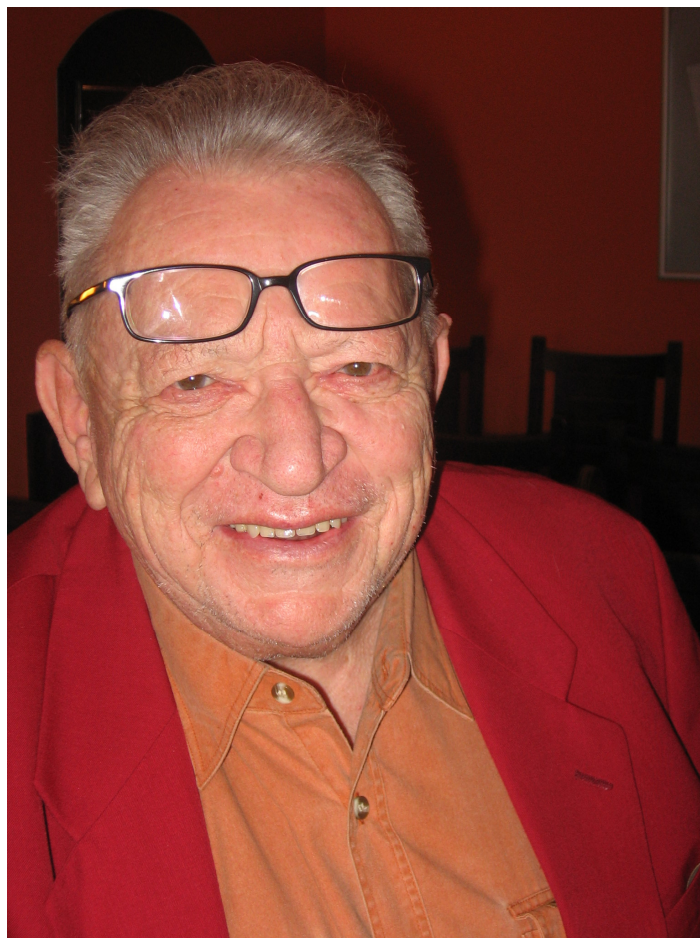
JUDr. et PhDr. Miloslav Stingl

a národy Střední a Jižní Ameriky. Určitě stejné cestovatelské touhy vyvolával i v ostatních čtenářích, vždyť jeho knihy se dočkaly přes 230 vydání ve 31 jazycích. Je jedním z nejpřekládanějších českých autorů v zahraničí, jeho knihy slavily úspěch v Peru, Argentíně, ale třeba i v Arménii nebo Japonsku.