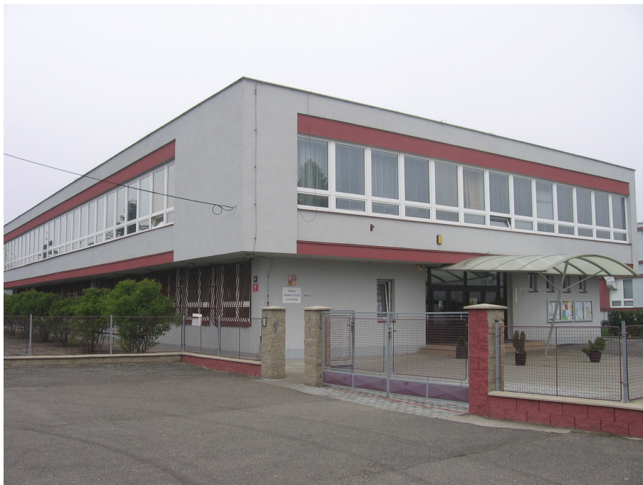
Střední odborné učiliště gastronomie, U Krbu 45

Žáci mají možnost hlouběji se vzdělávat prostřednictvím různých klubů, přednášek a exkurzí. Škola pořádá také barmanský kurz. Své odborné dovednosti uplatňují v různých soutěžích regionálního i celostátního rozsahu. Žáci mají možnost zapojit se do sportovního dění - tenis, florbal, gymnastika, fotbal a jiné. Škola pořádá ve spolupráci se školami v Německu, Finsku a na Slovensku výměnné pobyty pro své žáky. Získat nové zkušenosti studenti mohou také na několikaměsíční praxi ve Švýcarsku, Finsku a Německu.