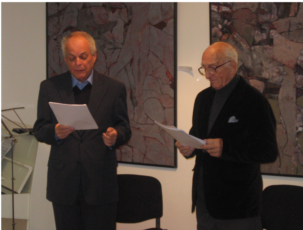
Pocta Karlu Čapkoví v Galerii DESET