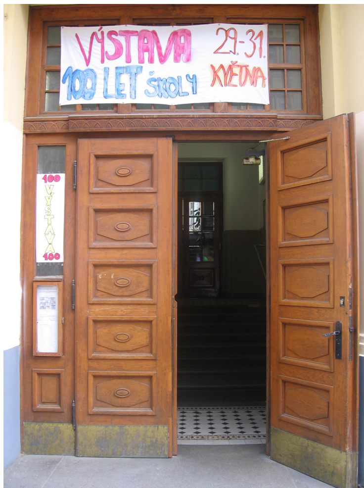
Vstup do školy ZŠ Kodaňská při oslavě 100. výročí založení školy

Škola se dlouhodobě účastní „Srdíčkových dnů“ pořádaných nadací Život dětem. Finanční částky, které se nákupem srdíček získaly, se využívají pro zakoupení přístrojů pro nemocné děti. Kromě toho uspořádali žáci sbírku na pomoc opuštěným a týraným zvířatům.