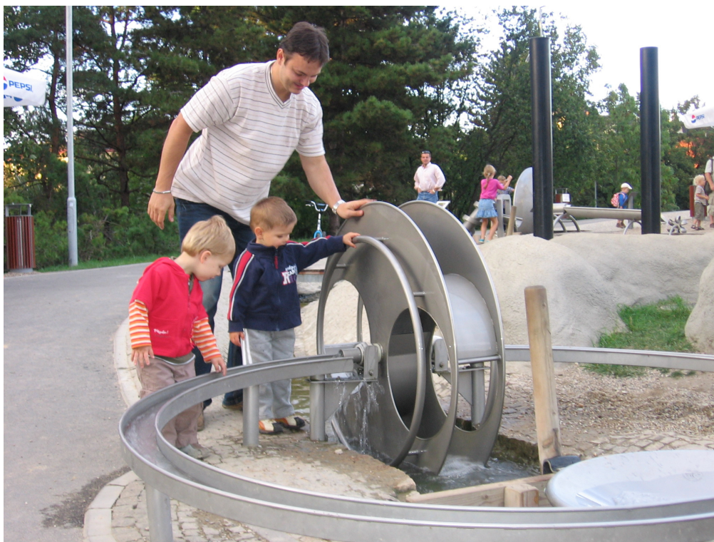
Vodní svět v areálu Gutova

Kluziště již bylo hotovo v roce 2007 na přelomu února a března, ale kvůli mírné zimě se oficiální otevření konalo až letos. Provoz ledové plochy je vzhledem k venkovnímu umístění omezen technologicky do sedmi stupňů nad nulou. Krytá ledová plocha vznikla v jihozápadním sektoru areálu za 20 milionů korun; na tuto investici Praze 10 přispělo hlavní město. V létě by se tento prostor měl využít třeba pro stolní tenis, kulečnick nebo stolní fotbal.