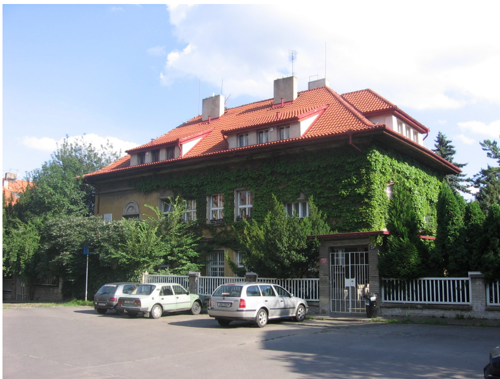
Dům bratří Čapků

Karel Čapek se také proslavil jako dramatik. Napsal například komedii Loupežník (1920), která se dočkala filmové podoby v roce 1931, drama R.U.R. (1920), kde poprvé zaznělo dnes v celém světě užívané slovo robot, Ze života hmyzu (1921), které napsal spolu s bratrem Josefem, nebo Věc Makropulos (1922). Obavu z Hitlera a obavu z fašismu promítl i do her Bílá nemoc (1937) a Matka (1938).