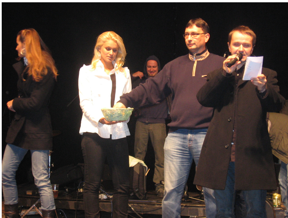
Starosta Prahy 10 Mgr. Vladislav Lipovský losuje na Dnech Prahy 10

Koncem května a v červnu 2008 starosta Mgr. Vladislav Lipovský zase besedoval se žáky devátých tříd základních škol Prahy 10. Školáci se zajímali především o bezpečnost v Praze 10, o životní prostředí, kriminalitu, problém drog, ale i o možnosti využití volného času nebo jak lze získat v Praze 10 byt. Dále se studenti zajímali o nezaměstnanost v městské části, ale otázky směřovaly i na to, jak vypadá starostův pracovní den.