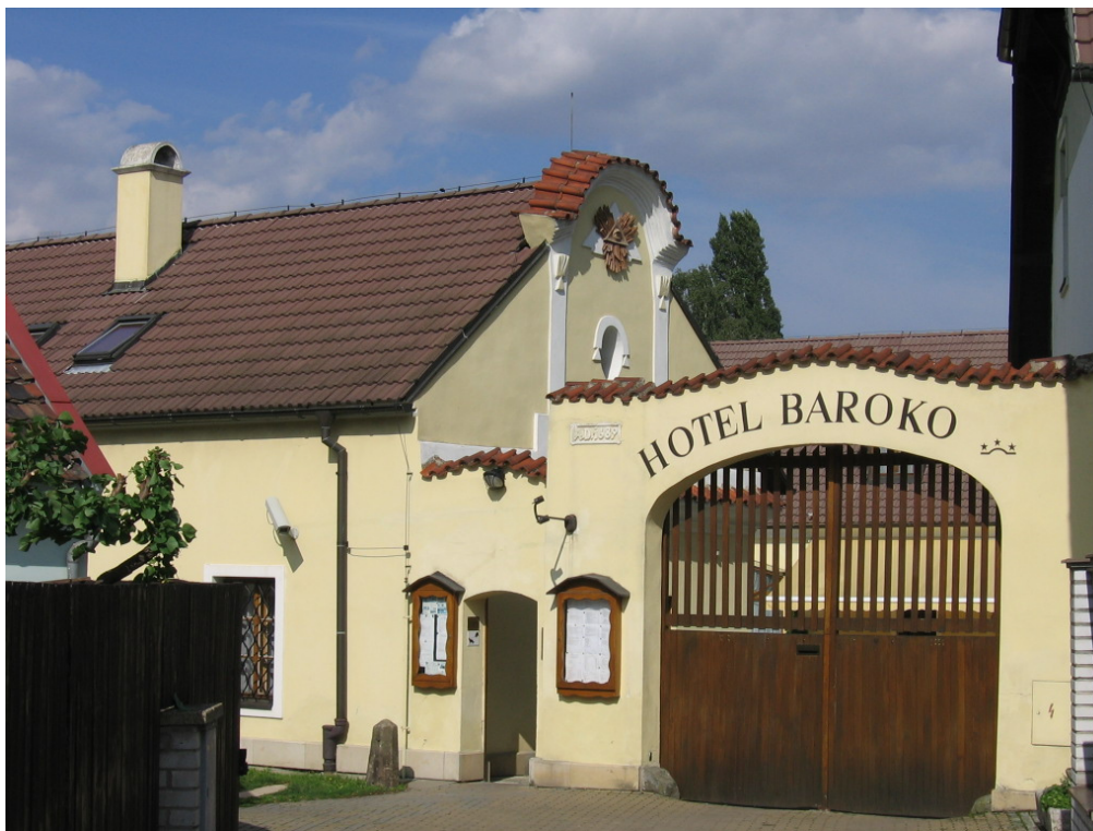
Hotel Baroko v Malešicích