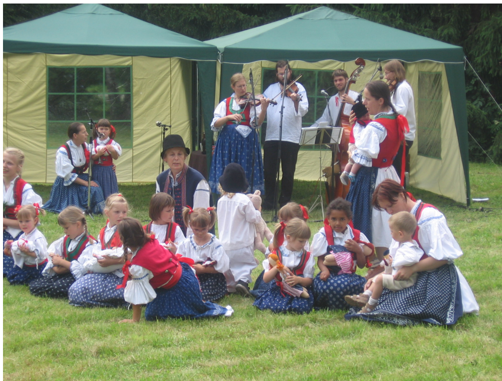
Svátek hudby v Gercenově 911

Zpíval, hrál a tančil dětský folklorní soubor Vonička a lidová muzika Kyčera . Zazněly zde známé lidové písničky, členové souboru zatancovali valašské tance a návštěvníci mohli také obdivovat jejich kroje.