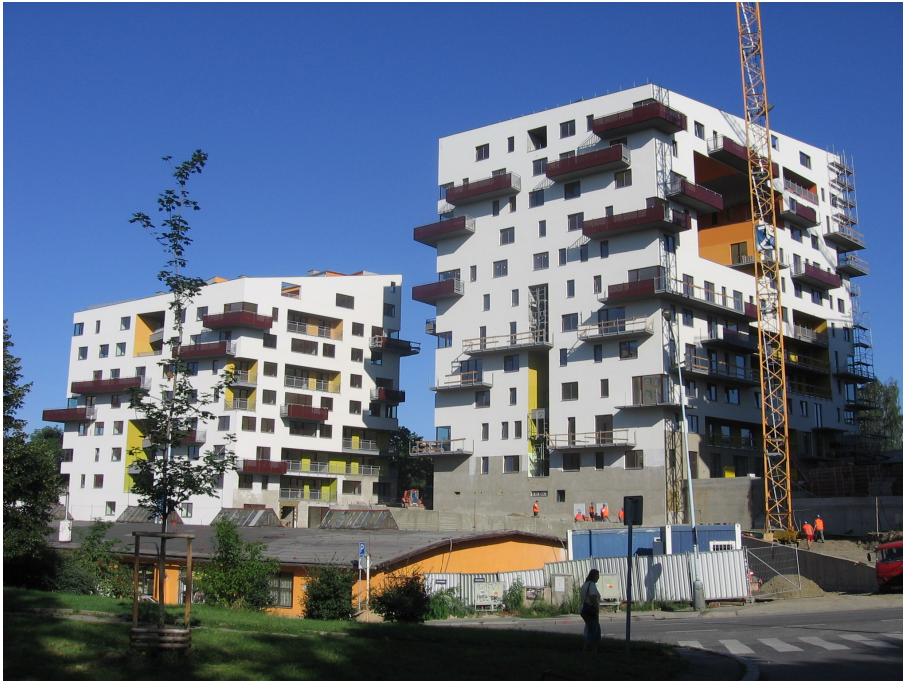
Bytový soubor Slatinka

Internetové stránky jsou: www.slatinka.cz .