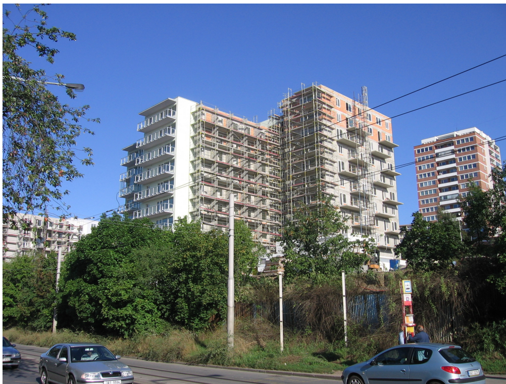
Obytný soubor Bohdalec

Významnou roli ve vzhledu objektů hrají velké prosklené plochy francouzských oken s jednoduše členěnými fasádami s jemně probarvenou omítkou, které doplňují zároveň pozinkované zámečnické výrobky balkónových zábradlí a francouzských oken. Vzhled objektů dotváří převážně na jižních fasádách konstrukce pro zajištění nízké hladiny hluku v bytech, které v bytě umožní přirozené větrání. Tyto konstrukce tvoří kombinace zasklených balkónů a zvukově pohltivých neprůhledných příček mezi jednotlivými balkóny.